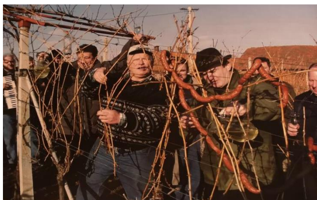
Slika 3. Zalijevanje trsa i kobasica vinom