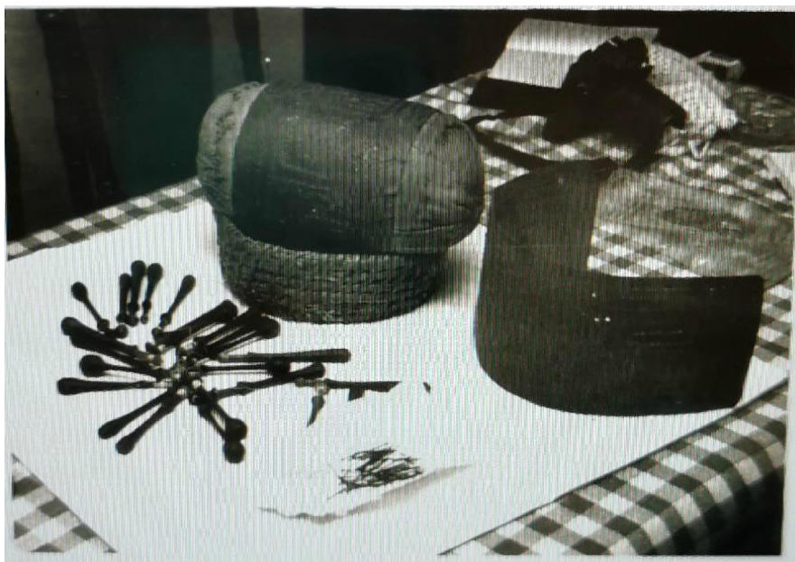
Slika 7. Oprema za izradu čipke