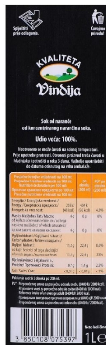
Slika 12. Prikaz hranjivih vrijednosti Vindi 100% juice naranča soka