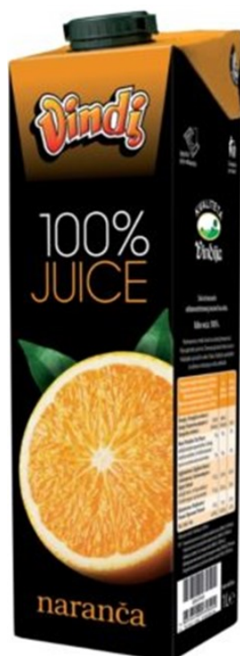
Slika 11. Vindi 100% juice naranča sok