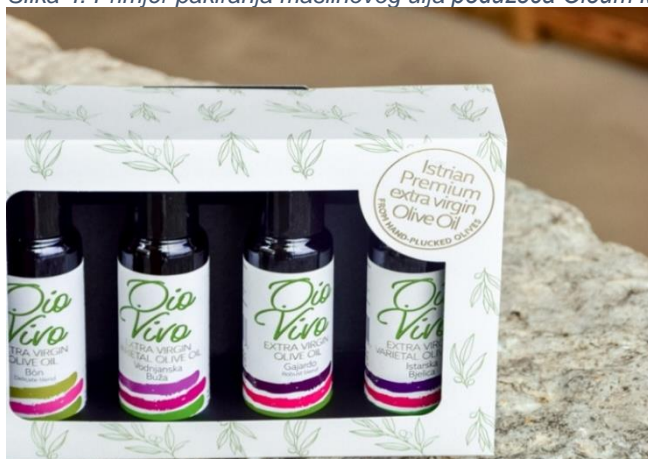
Slika 4. Primjer pakiranja maslinovog ulja poduzeća Oleum Maris