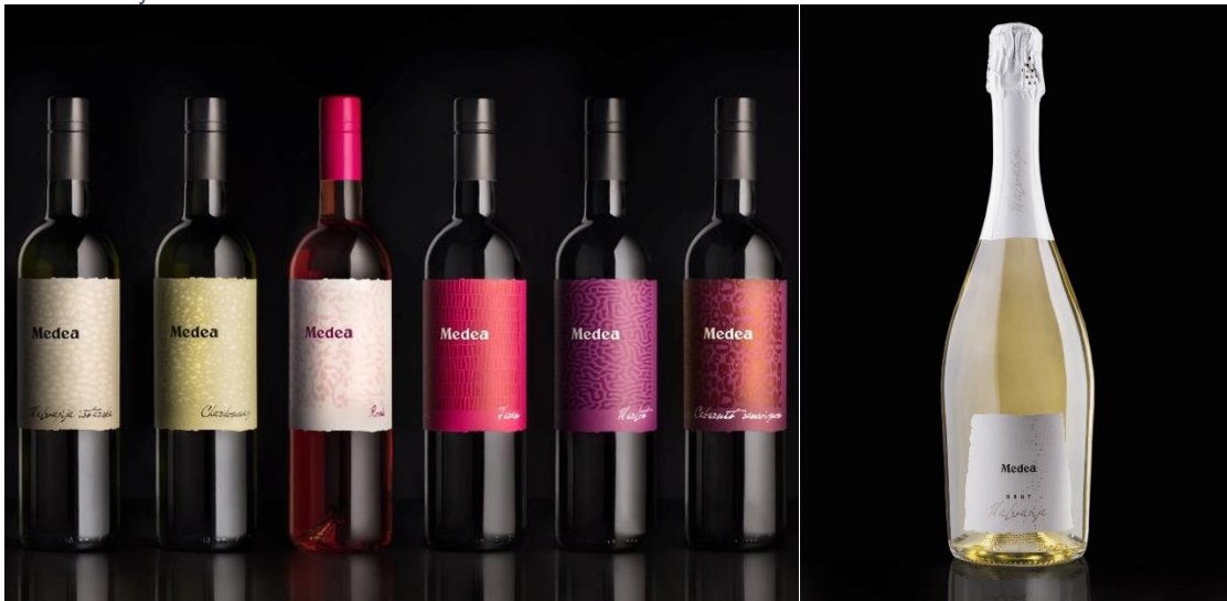
Slika 9. Linija Medea vina