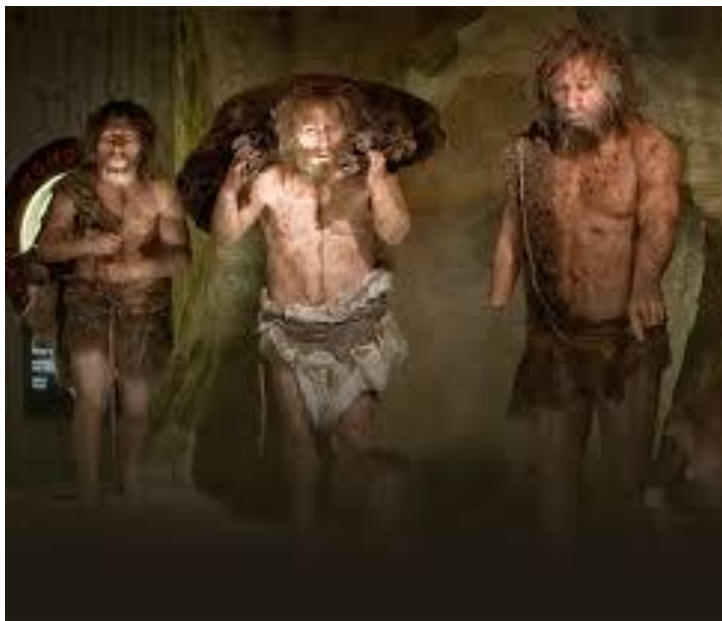
Slika 6. Neandertalci i plijen