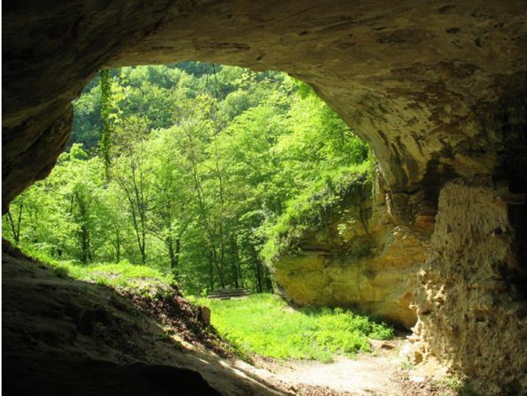
Slika 2. Špilja Vindija

zbog njene dobre očuvanosti i dostupnosti čine ju veoma atraktivnom turističkom lokacijom. 17