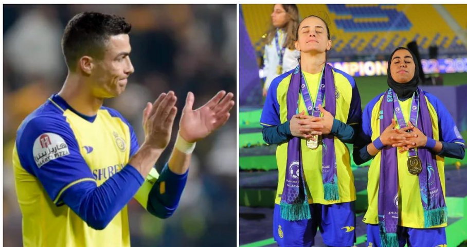
Slika 6. Ženska nogometna reprezentacija kopira Ronaldovo slavlje nakon osvojenog prvog mjesta