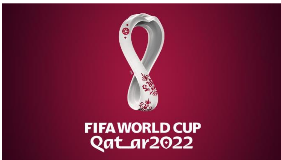
Slika 1. FIFA Svjetsko prvenstvo u Kataru 2022. Logo