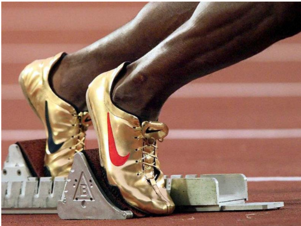
Slika 10. NIKE Zlatne cipele Michaela Johnsona