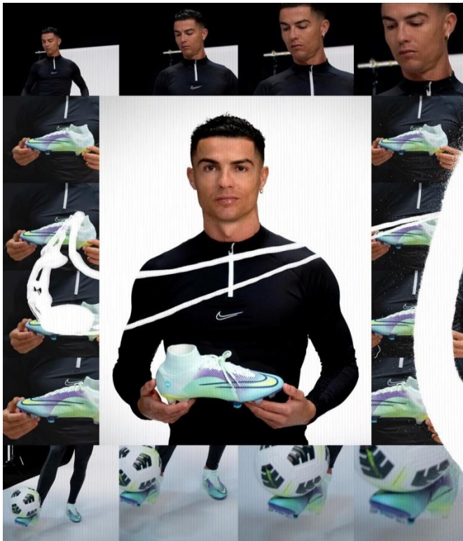
Slika 2. NIKE plaćeno partnerstvo s Cristianom Ronaldom