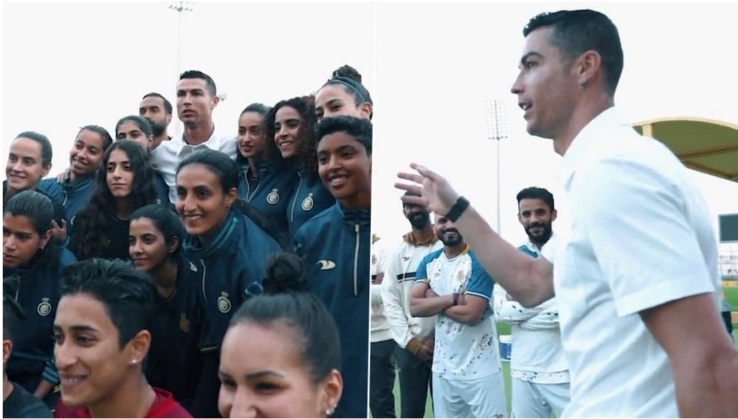
Slika 5. Cristiano Ronaldo i ženska nogometna reprezentacija Al-Nassra