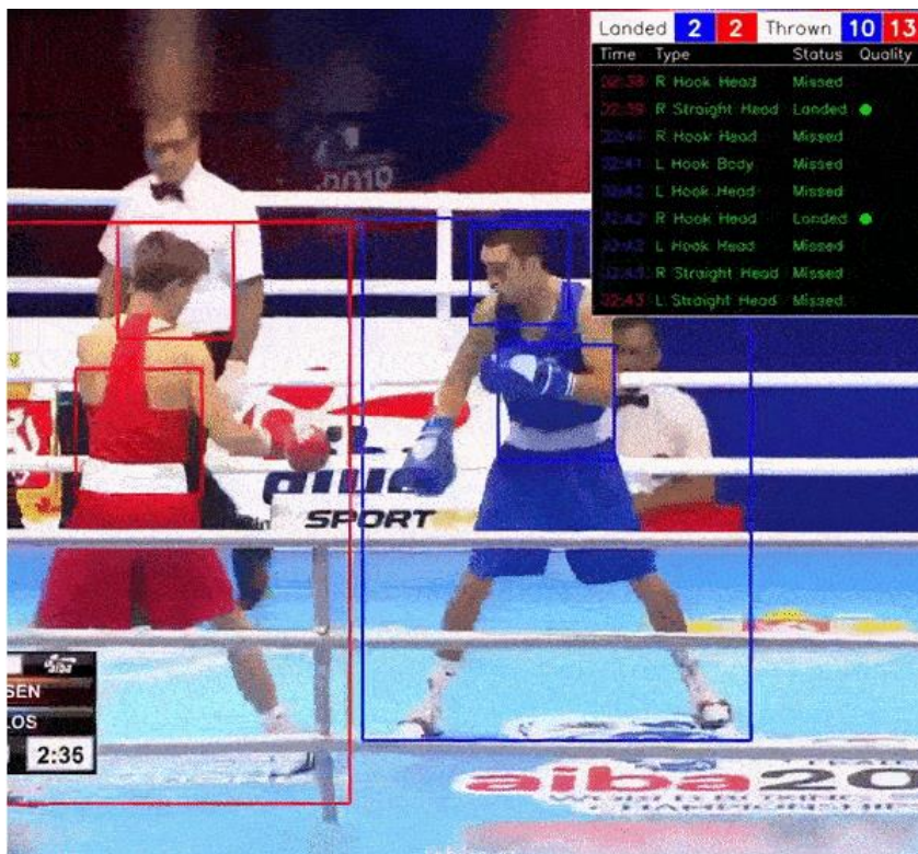
Slika 11. Umjetna inteligencija (AI) u sportu – tehnologija računalnog vida