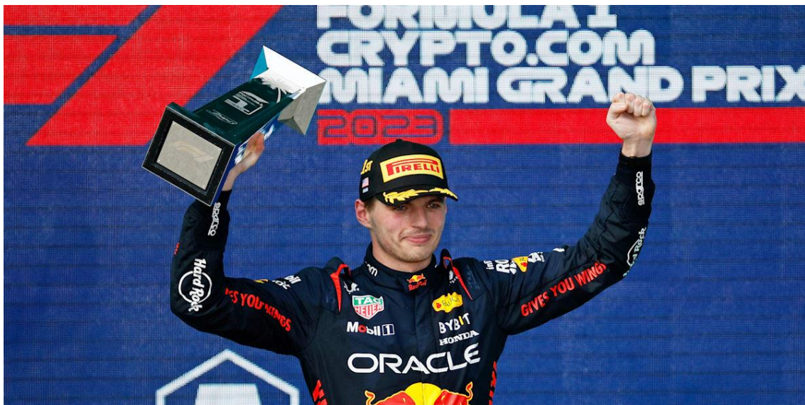
Slika 7. Miami Grand Prix 2023 - pobjednik Max Verstappen