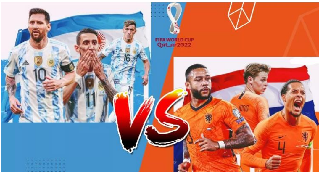
Slika 8. FIFA Svjetsko prvenstvo u Kataru 2022. Argentina i Nizozemska