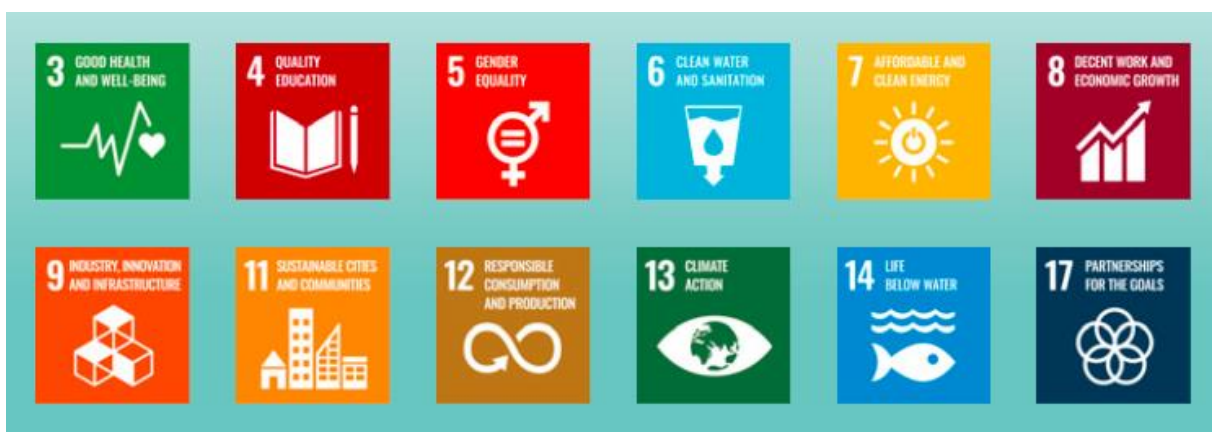
Slika 11. ključni pokazatelji uspješnosti