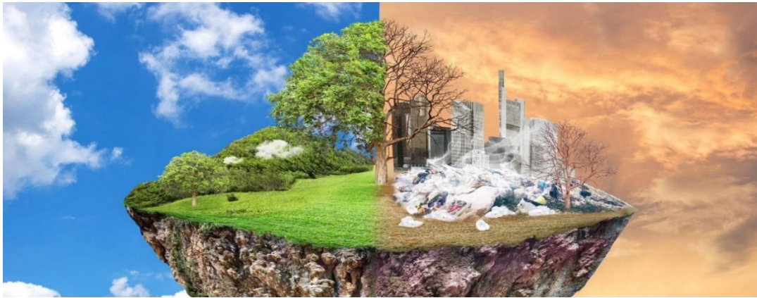
Slika 5. Različite vrste zagađenja