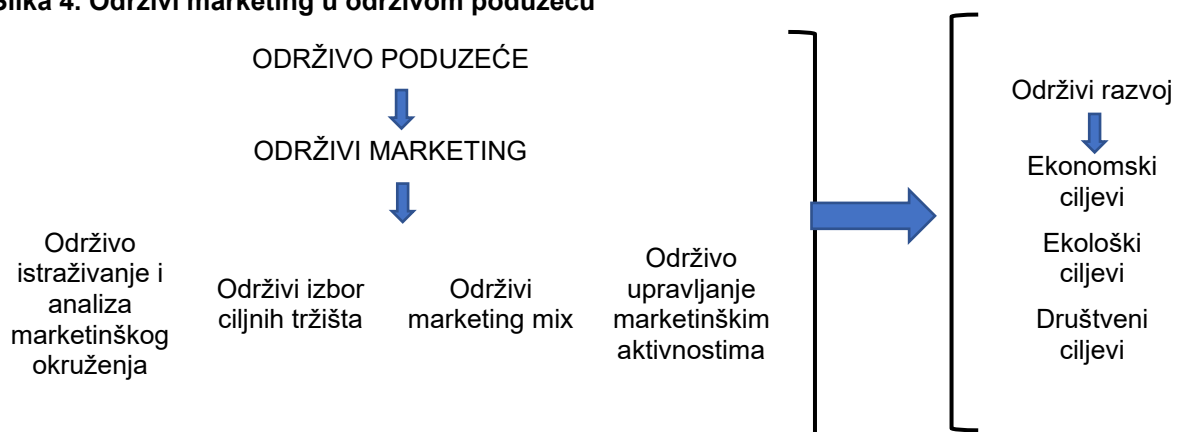
Slika 4. Održivi marketing u održivom poduzeću

Izvor: T. Trojanowski, „Product in the sustainable marketing concept“, Modern management review , vol. XIX, no. 21, 2014., str. 146.