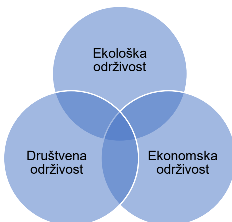
Slika 1. Ilustracija odnosa između dimenzija održivosti