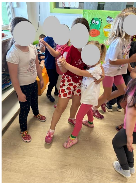
Slika 11. Gibanje djece tijekom slušanja skladbe.