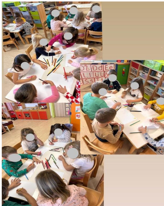
Slika 5 Djeca crtaju slušajući glazbu

Promatrajući dječje reakcije tijekom prvog slušanja, može se reći kako su djeca bila opuštena i vrlo koncentrirana tijekom slušanja skladbe. S obzirom na to da su prethodne dvije aktivnosti slušanja skladbe provodili sjedeći u krugu, primijetilo se kako su djeca tijekom sjedenja za stolom bila više koncentrirana. Trinaestero djece prepoznalo je da je skladba izvedena samo na klaviru dok je šestero djece smatralo da uz klavir skladbu izvodi i violina. Većina djece zna kako se svira klavir te da klavir ima tipke, crne i bijele. Starija djeca, predškolarci, znali su prepoznati da je skladba bila sporija dok su mlađa djeca smatrala da je skladba u određenim trenucima bila spora, ali i brza. Individualnim razgovorom sa svakim pojedinim djetetom dobiveni su rezultati kako se pojedino dijete osjećalo tijekom slušanja. Sedamnaestero djece osjećalo se sretno. Od njih sedamnaestero koji su se osjećali sretno, troje djece osjećalo se opušteno te se dvoje osjećalo sretno i tužno. Jedno dijete se osjećalo samo opušteno, a tužno se osjećalo jedno dijete. Prije crtanja djeca su bila sumnjičava, no nakon što su poslušali skladbu započeli su crtati bez ikakvih poteškoća (Slika 5.).