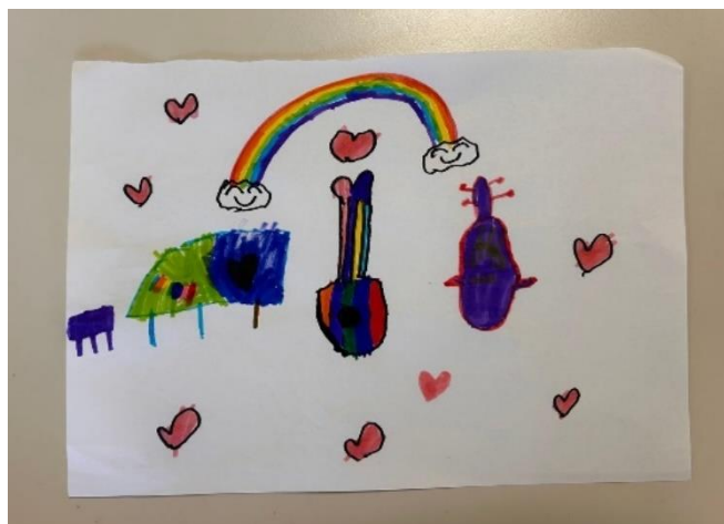
Slika 2 Prikaz instrumenata koji izvode skladbu.