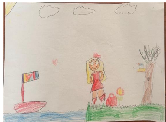
Slika 9. T.M. „Mjesečeva sonata“