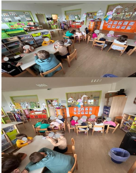
Slika 4 Razmještaj djece tijekom slušanja skladbe.

Tijekom aktivnosti djeca su promatrana i bilježene su njihove reakcije i izjave. Za aktivnost su pripremljeni: zvučnik, papiri A4 i bojice. Prije prvog slušanja djeci je dana uputa da tijekom slušanja skladbe obrate pozornost na instrumente. Nakon slušanja bila su upitana koji su instrument/instrumente čuli te su im se, nakon njihovih odgovora, pokazala fotografija instrumenta. Upitani su znaju li kako se taj instrument zove i kako se svira. Prije drugog slušanja zamoljeni su da obrate pozornost na tempo skladbe, je li tempo brz ili spor. Nakon odslušane skladbe, razgovaralo se o njihovom doživljaju tempa skladbe. Za zadnji dio ovog istraživanja predloženo je djeci da se kod trećeg slušanja neće razgovarati, nego da će svoje dojmove i doživljaje izraziti crtežom. Autorica im je rekla da će dobiti čarobne papire i bojice, a bojice su čarobne jer one mogu prikazati emocije i osjećaje te pomoću svojih ručica mogu dočarati sliku glazbe na čarobnom papiru. Podijeljeni su im papiri i bojice. Kada sva djeca završe s