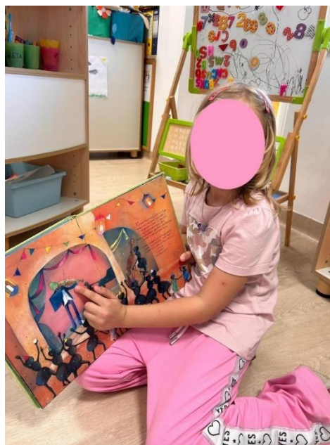
Slika 1 Djevojčica pronalazi u knjizi instrumente koji izvode skladbu.

Rezultati su pokazali kako se od osamnaestero djece, sedamnaestero djece osjećalo opušteno te se jedno dijete osjećalo tužno. Skladba je odabrana iz razloga što je u autorici budila mir i opuštenost, a isto je utjecala i na djecu. Na pitanje što su osjećali tijekom slušanja, većina djece rekla su da su sanjali i bili u svijetu snova: „Ja sam sanjala da smo ja i prijateljice šetale i gledale smo ptičice uz rijeku.“ (H.J.); „Ja sam sanjala da sam na oblaku i da skačem.“ (D.D). Djeca su izrazila želju da još jednom poslušaju skladbu te se razgovaralo o instrumentima. Šesnaestero djece je prepoznalo instrumente kojima je skladba odsvirana, klavir i violončelo. Nekolicina njih rekla su kako je to violina, a dvoje djece reklo je kako čuju trubu. Krećući se u ritmu i tempu skladbe, većinom su sudjelovale djevojčice koje su se kretale lagano, elegantno na prstićima poput balerina. Dječaci su uglavnom stajali sa strane te ih je djevojčica T.M. pozivala na ples. Djevojčica S.M. i dječak V.Z. plesali su u paru. Uslijedila je slobodna igra po centrima (Slika 1).