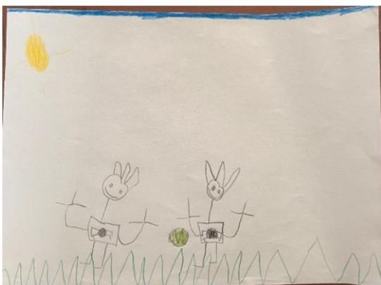
Slika 8. L.L. „Nogomet“