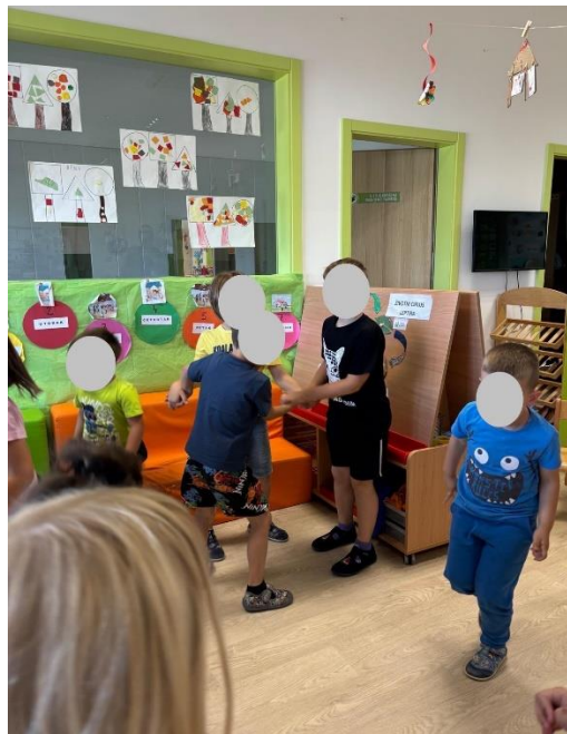
Slika 10 Dječaci skakuću u krugu držeći se za ruke.

Promatrajući kako su djeca prolazila svojim prstićima po rukama, ustanovljeno je kako djeca prepoznaju tempo skladbe, ali neka djeca, većinom ona mlađa u dobi od 3 do 4 godine, možda još uvijek ne razumiju pojmove brzo i sporo. Od devetnaestero djece, šesnaestero ih je prepoznalo da je skladba brza i živahna. Četvero djece (mlađi) reklo je kako je skladba brza, ali da je i spora. Također, jedan dječak (L.L.) primijetio je kako se melodija cijelo vrijeme ponavlja uz male izmjene. Djeca su se kretala tijekom slušanja skladbe, neka su skakutala poput konjića, baš u ritmu skladbe. Dobro je primijetiti da su neka djeca uglavnom samostalno plesala, a nekoliko dječaka skakutalo je u krug držeći se za ruke (Slika 10).