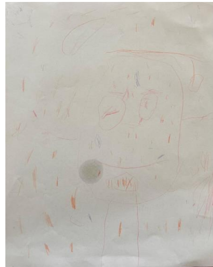
Slika 7. S.M. „Sreća i tuga“