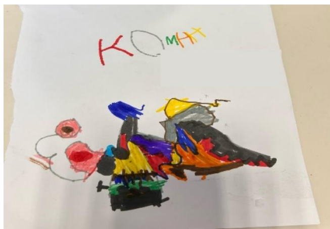
Slika 3 Prikaz dječjeg rada „Stroj za izradu klavira“