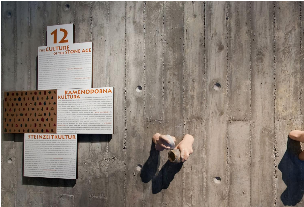
Abb. 3 Informationstafeln im Neandertalmuseum in Krapina

Aufgrund des mangelnden Platzes auf den Informationstafeln im Museum werden häufig Audioguides als Vermittler der ausführlicheren Informationen verwendet. In den nächsten Unterkapiteln wird der Audioguide im Kroatischen (AS) und Deutschen (ZS) anhand von den Übersetzungsstrategien und anderen Kriterien zum Aufbau des Audioguides analysiert.