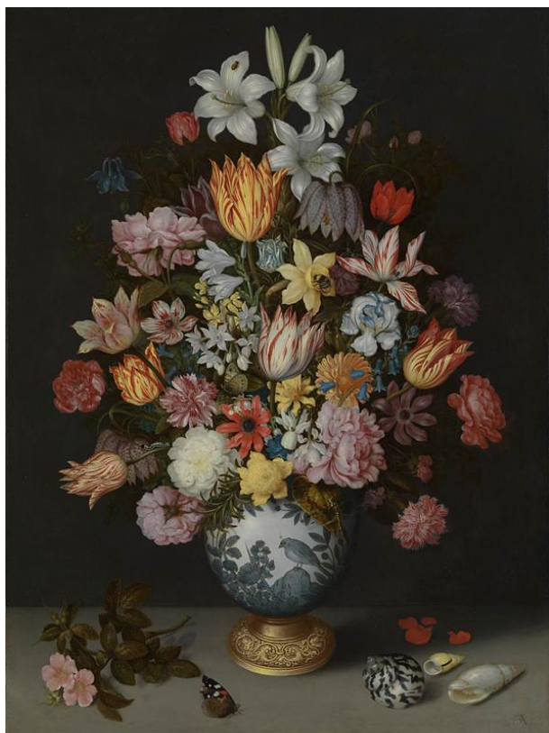
Prilog 4. Ambrosius Bosschaert Stariji, Mrtva priroda s cvijećem u Wan-Li vazi na polici s ostalim cvijećem, školjkama i leptirom, 1609.-1610.