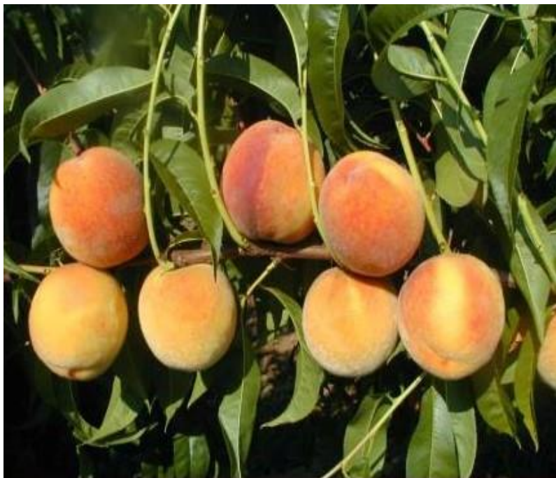
Slika 6. Sorta 'Redhaven'

navodi s obzirom da sazrijeva na sredini vremena dozrijevanja bresaka, uzima se kao standard za određivanje vremena dozrijevanja kod drugih sorti. Isti autor navodi da je vrlo zastupljena u uzgoju i ekonomski značajna sorta, navodeći kao razloge dobru otpornost na manipulaciju, transport i kvalitetu plodova. Vrsaljko (1999.) navodi da je ova sorta u području Ravnih Kotara pokazala najmanju osjetljivost prema pozebi. Medin (1998.) još dodaje da je u Hrvatskoj vodeća sorta u svim krajevima.