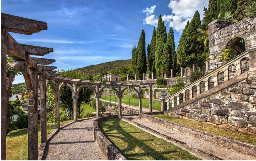
Slika 1: Amerikanski vrtovi