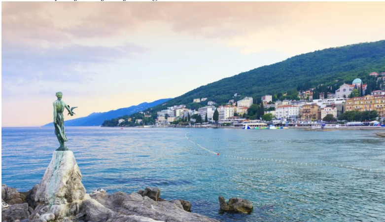
Slika 2: Opatija i djevojka s galebom