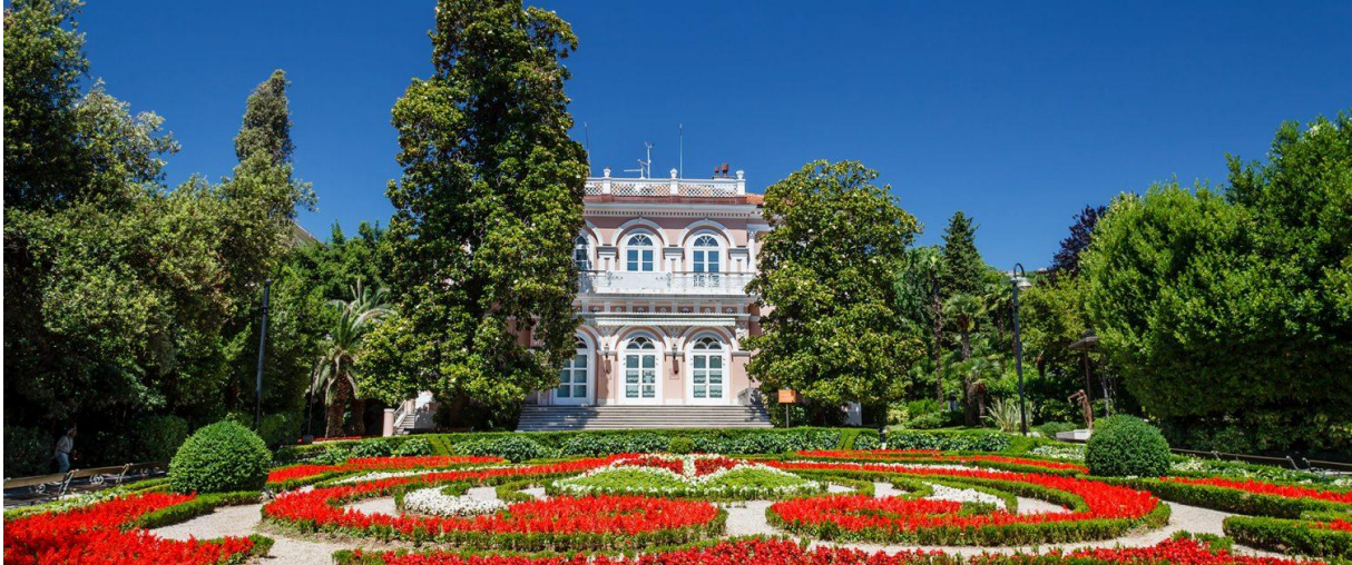
Slika 3: Villa i park Angiolina