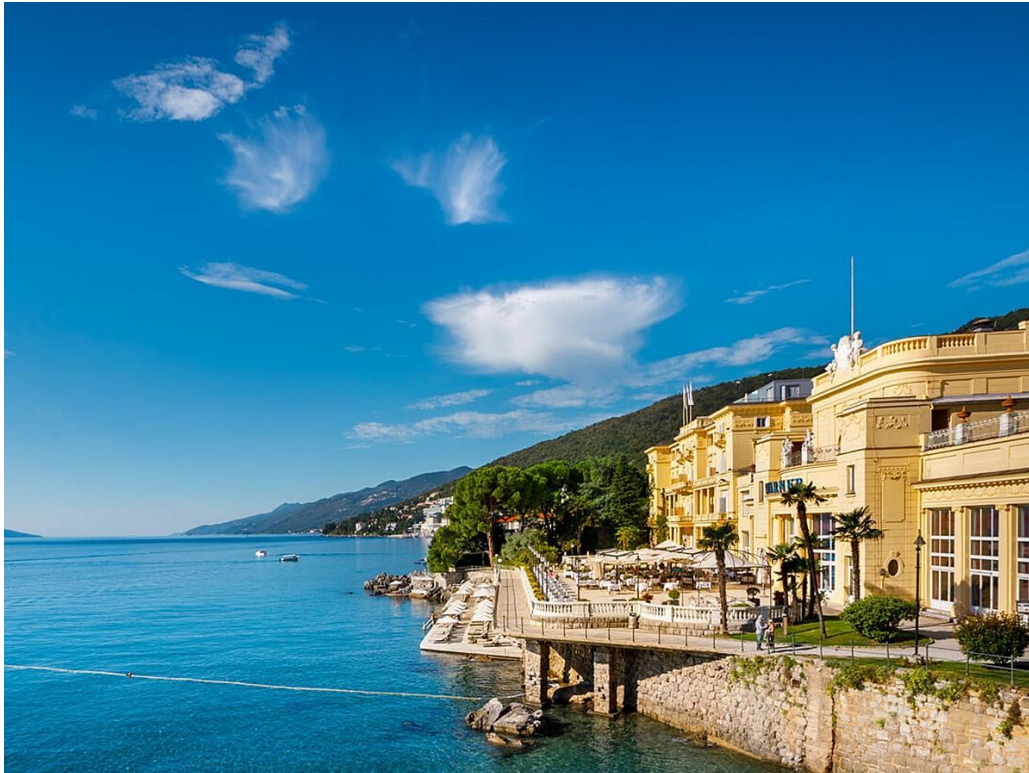
Slika 4: Hotel Kvarner