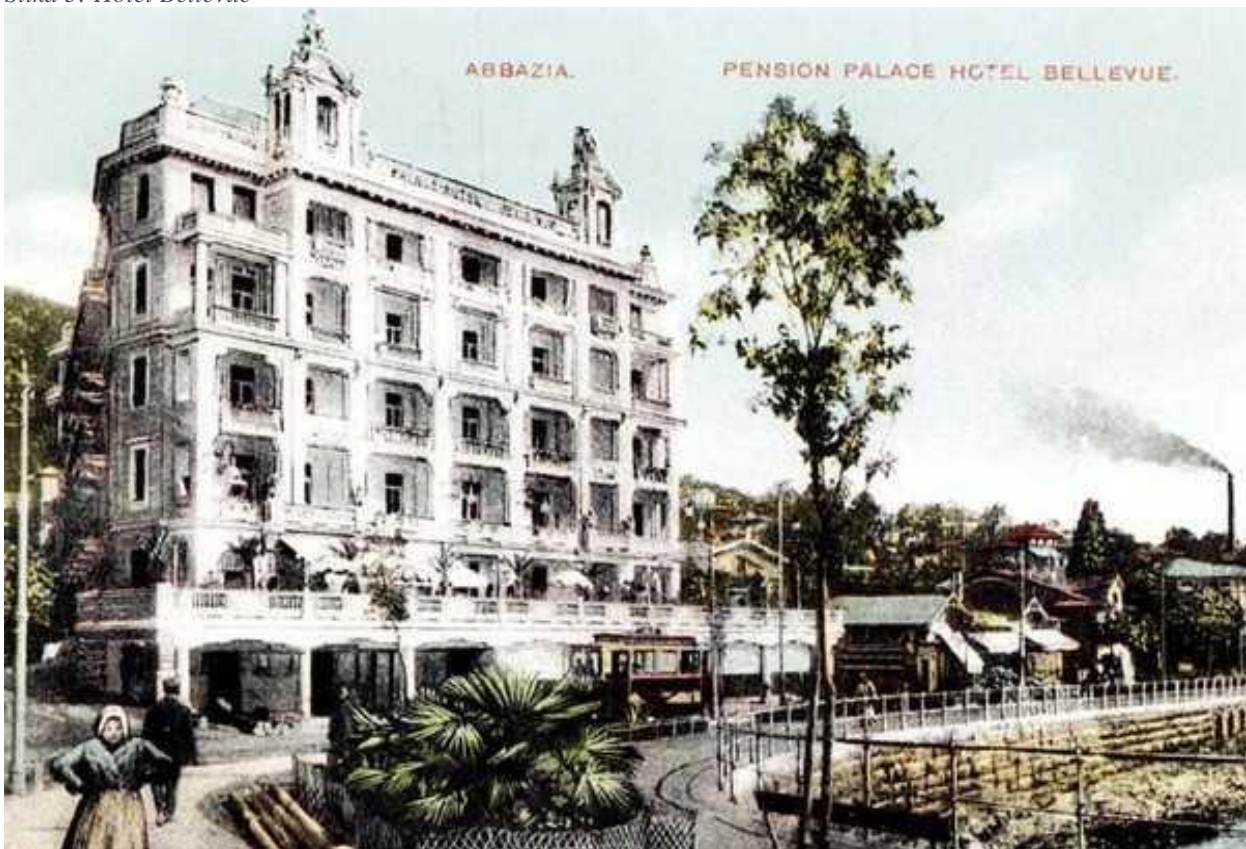
Slika 5: Hotel Bellevue