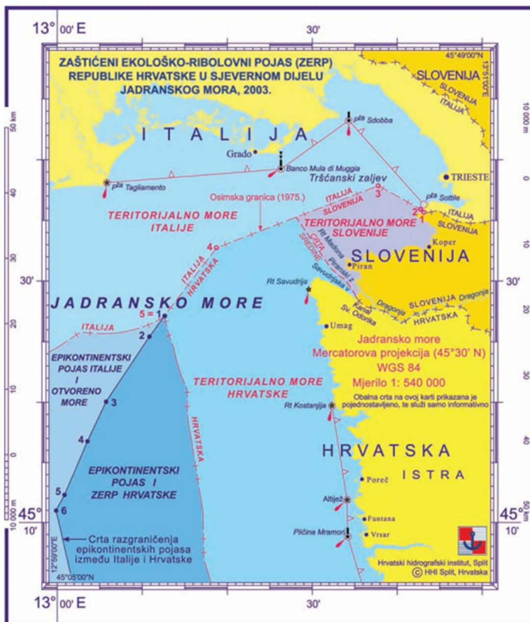
Slika 11. ZERP Republike Hrvatske u sjevernom dijelu Jadranskog mora (Gržetić i dr., 2010: 52)

Slovenija je ovaj svoj postupak opravdavala tvrdnjom da je nakon osamostaljenja i raspada Jugoslavije zadržala pravo na teritorijalni izlaz na otvoreno more i samim time smatra da ima mogućnost proglasiti epikontinentalni pojas (Gržetić i dr., 2010). Takve granice su navodno trebale biti samo privremene (Degan, 2019). Iznesena tvrdnja, s obzirom da nijedna republika bivše SFRJ nije imala nikakav poseban izlaz do otvorenog mora uključujući i Sloveniju, nema nikakve pravne temelje i ne može se smatrati validnom. Teritorijalno more