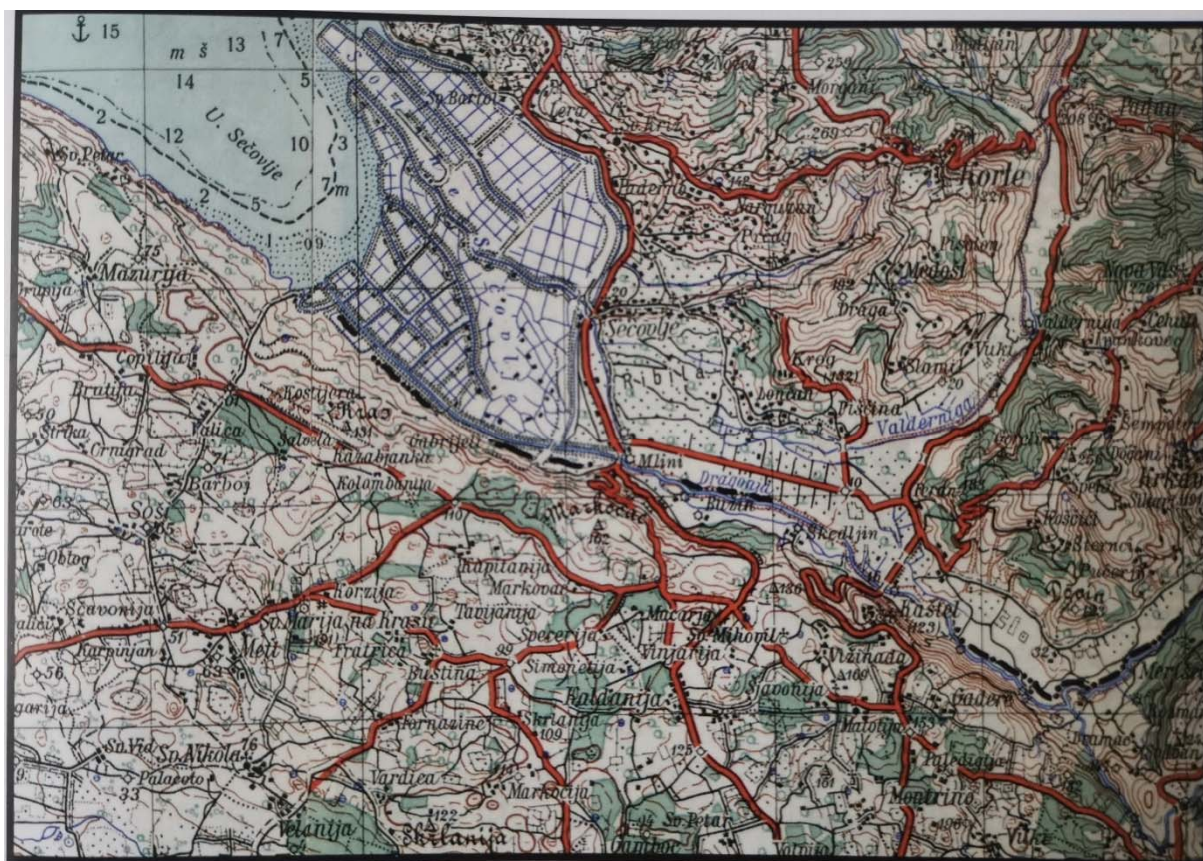
Slika 2. Službena topografska karta 1:50 000 Vojnogeografskog instituta u Beogradu iz 1957. s prikazom republičke granice i Dragonjom nakon njene regulacije (Tomaić, Altić, 2013: 151)

Unatoč činjenici da je granica između hrvatske i slovenske strane određena na samoj rijeci Dragonji, Kanal sv. Odorika stanovništvo počinje nazivati Dragonjom i preuzima veći dio prirodnog toka Dragonje koji se počinje nazivati Starom Dragonjom (Tomaić, 2011). Razlog zašto se Kanal svetog Odorika počinje tretirati kao glavni tok leži u činjenici što je bio kraća i brža rijeka od vijugave i muljevite Dragonje (Tomaić, Altić, 2013). Na taj se način od ranije postojeći tok sporne rijeke ispred mosta na cesti Buje – Kopar prekida i odlazi u Kanal svetog Odorika, koji postaje nastavak starog toka Dragonje i završava u moru, točnije u vodama Savudrijske vale (Tomaić, Altić, 2013).