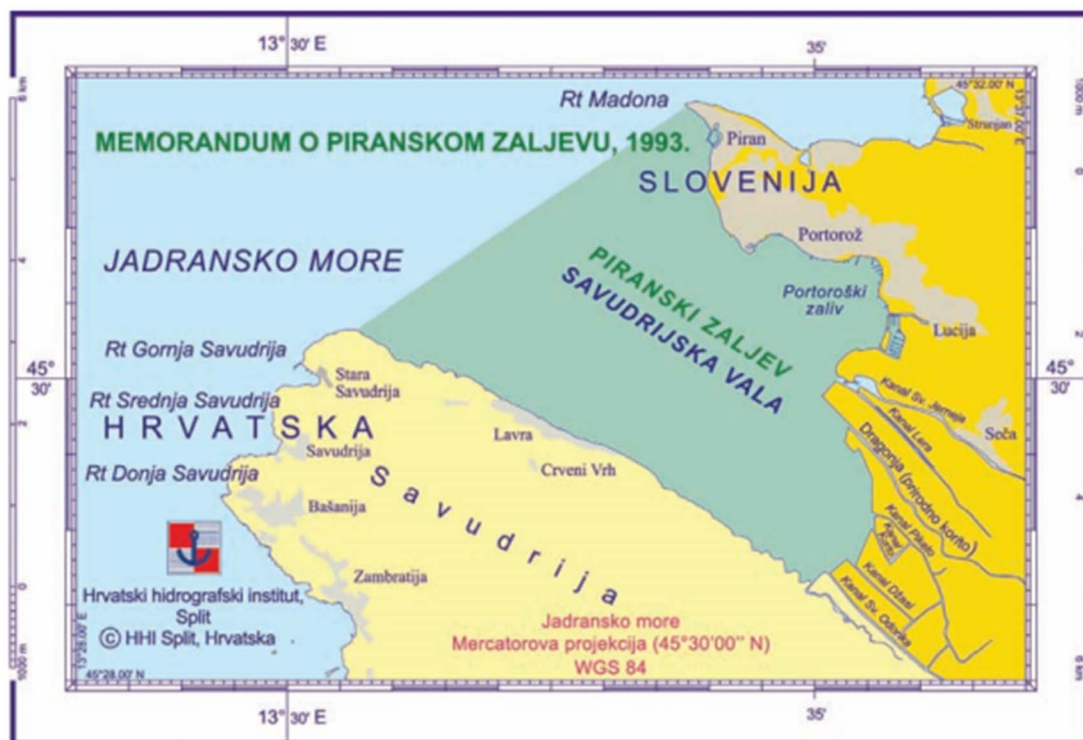
Slika 9. Razgraničenje Hrvatske i Slovenije prema prijedlogu Memoranduma o Piranskom zaljevu, prema kojemu je čitav prostor Savudrijske vale slovensko teritorijalno more (Gržetić i dr., 2010: 40)

Dana 7. travnja 1993. godine slovenski parlament donosi Memorandum o Piranskom zaljevu . Činjenica da je spomenuti dokument donijelo najviše zakonodavno tijelo novonastale slovenske države pokazuje njegovu važnost. Na samom početku Memoranduma iz 1993. godine, Slovenija naglašava kako morska granica Slovenije i Hrvatske nikada nije bila određena i da ju je potrebno tek definirati. Dalje naglašava svoje težnje za očuvanjem cjelovitosti Savudrijske vale pod vlastitim suverenitetom. To bi značilo da bi hrvatska obala u tom dijelu Istre bila okružena slovenskom granicom na moru (Slika 9.). Osim toga, Slovenija se zalaže i za izlaz na otvoreno more. U dokumentu se poziva na uvažavanje historijskog naslova i drugih posebnih okolnosti (Turkalj, 2002).