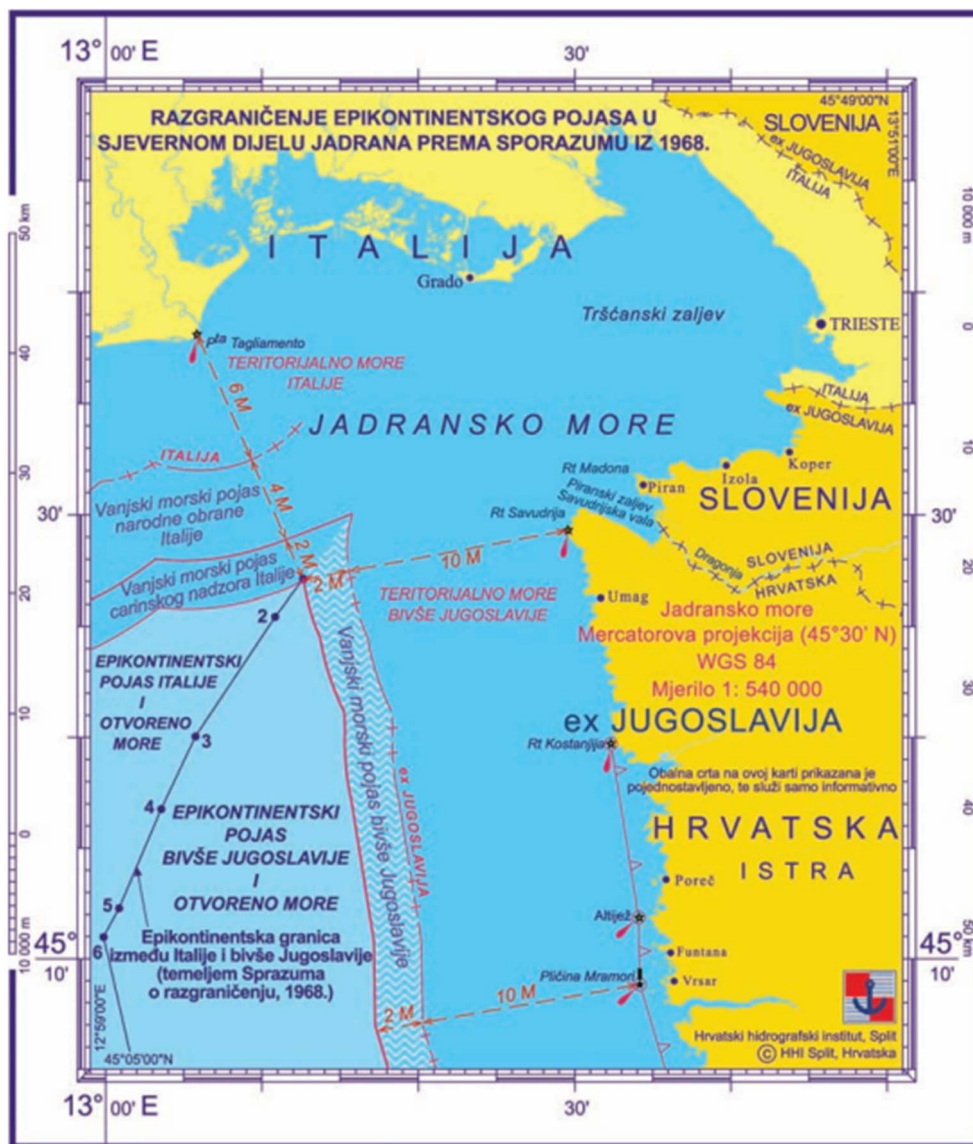
Slika 3. Razgraničenje epikontinentalnog pojasa u sjevernom dijelu Jadrana prema Sporazumu iz 1968. godine (Gržetić i dr., 2010:23)

Osimskim sporazumom iz 1975. godine dogovorena je, ne samo kopnena granica, nego i ona na moru između Italije i Jugoslavije (Slika 4.). Morska granica u Tršćanskom zaljevu polazi od uvale svetog Jerneja pa sve do hrvatsko-talijanske granice na samom izlazu iz zaljeva, kod točke na kojoj je širina mora prešla broj od 24 milje (Gržetić i dr., 2010). Budući da su Hrvatska i Slovenija zemlje koje su nastale raspadom Jugoslavije, dogovor uspostavljen Osimskim sporazumom iz 1975. godine nastavlja postojati i dalje, samo sada kao sporazum Italije s Hrvatskom i Slovenijom. S obzirom da pregovori Hrvatske i Slovenije o granici još uvijek traju, tada uspostavljena kopnena i morska granica i dalje je na snazi, sve