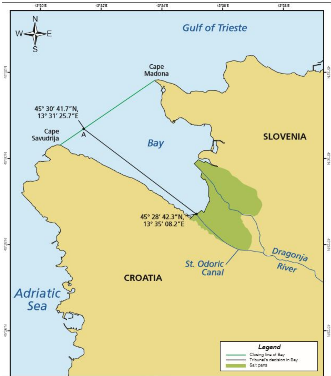
Slika 12. Razgraničenje u Savudrijskoj vali prema Sporazumu o Arbitraži (URL 4)