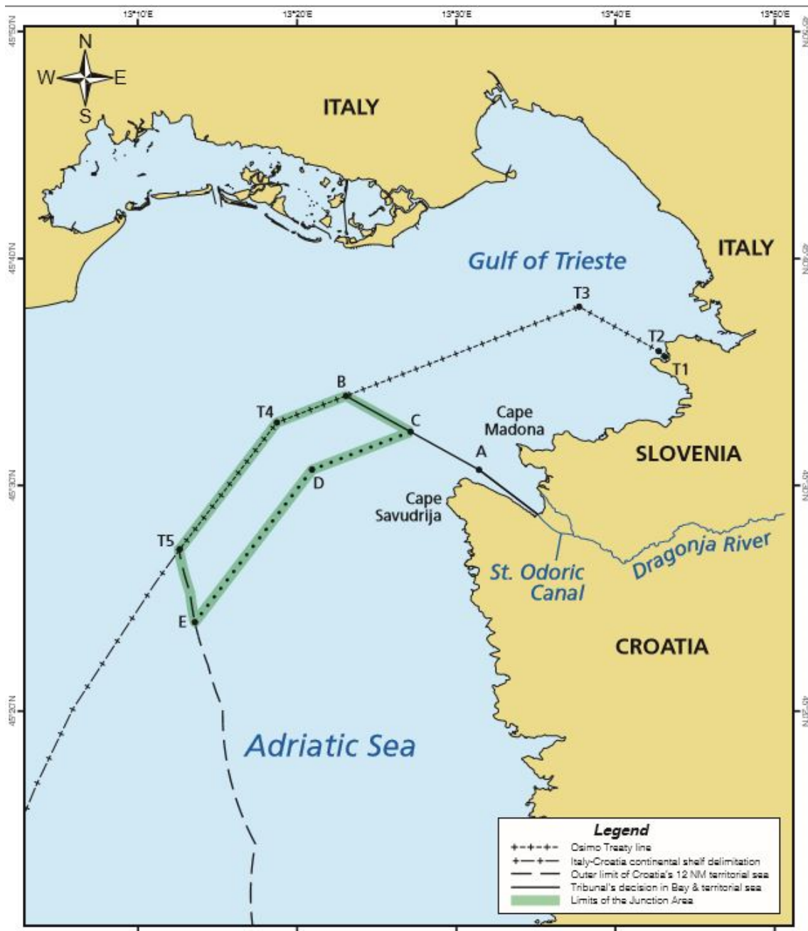
Slika 13. Razgraničenje prema Sporazumu o Arbitraži (URL 4)