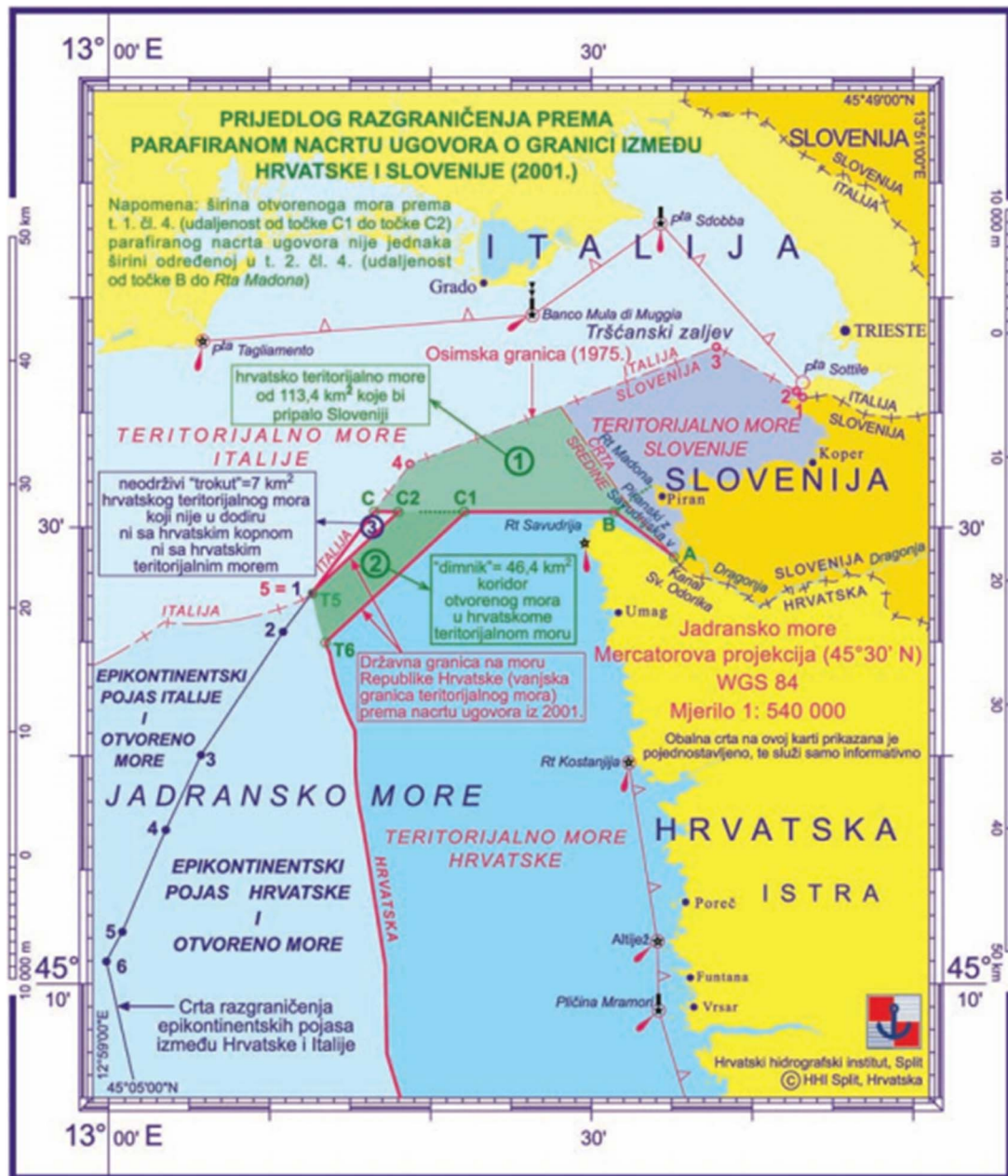
Slika 10. Prijedlog razgraničenja prema Sporazumu Drnovšek-Račan (Gržetić i dr., 2010: 50)

hrvatskog teritorijalnog mora površine od 46, 4 km 2 koji bi u tom slučaju ostao u području slovenskog koridora otvorenog mora u prostoru teritorijalnog mora Hrvatske. Uz samu granicu s Republikom Italijom ostao bi trokut teritorijalnog mora Hrvatske površine 7 km 2 koji ne bi imao nikakvog dodira s kopnom. Takav primjer razgraničenja na moru ne postoji nigdje drugdje u svijetu, stoga bi ovo bio presedan u praksi međunarodnog prava. Da je došlo do takvog raspleta događaja, Hrvatska bi sveukupno izgubila čak 166 km 2 mora i podmorja (Gržetić i dr., 2010), od čega bi čak 80 posto Savudrijske vale pripao Sloveniji (Vuk, 2018).