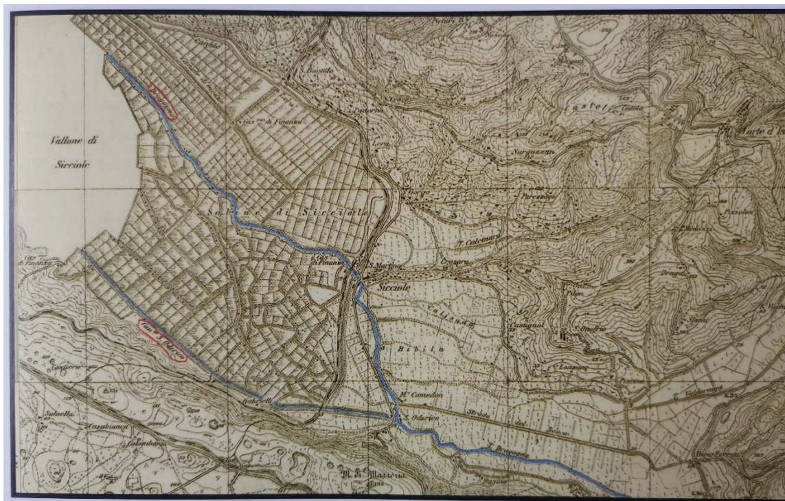
Slika 1. Talijanska topografska karta iz 1932. godine s Kanalom sv. Odorika i prirodnim tokom Dragonje (Tomaić, Altić, 2013: 147)

Nakon Drugog svjetskog rata dolina donje Dragonje nekoliko je puta bila poplavljena pri čemu su nastradale solane u Sečovlju. Stoga se između 1951. i 1954. godine provode radovi na regulaciji toka rijeke (Slika 2.) po naredbi zapovjednika Zone A Viktora Lenca (Tomaić, Altić, 2013). Kanal svetog Odorika, prvenstveno radi nastojanja da se polja zaštite od nakupljanja morske soli, biva proširen i produbljen (Tomaić, 2011). Prokapanjem Kanala svetog Odorika gotovo da je prestalo taloženje sedimenata u prostorima nekadašnjih naplavnih ravnica (Benac i dr., 2017).