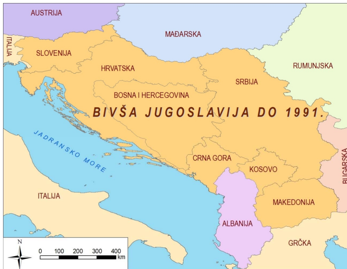
Slika 5. Hrvatska u sastavu Socijalističke Federativne Republike Jugoslavije prije raspada

Pregovori između Republike Hrvatske i Republike Slovenije započeli su netom nakon osamostaljenja dviju država 1991. godine (Slika 5.). Prvih godina samostalnog postojanja, Hrvatska je bila usmjerena na ratna zbivanja kao cijenu samostalnosti koju je morala platiti, stoga nije previše vremena i snage posvećivala spornom graničnom pitanju. Po završetku rata, intenziviraju se pregovori oko hrvatsko-slovenske granične linije, da bi vrhunac doživjeli Sporazumom o arbitraži kada je rješenje bilo gotovo vidljivo, no zbog neočekivanih zbivanja koja su poremetile plan da se spor okonča u što kraćem vremenu, pregovori između dviju država traju i danas (Tomaić, 2011).