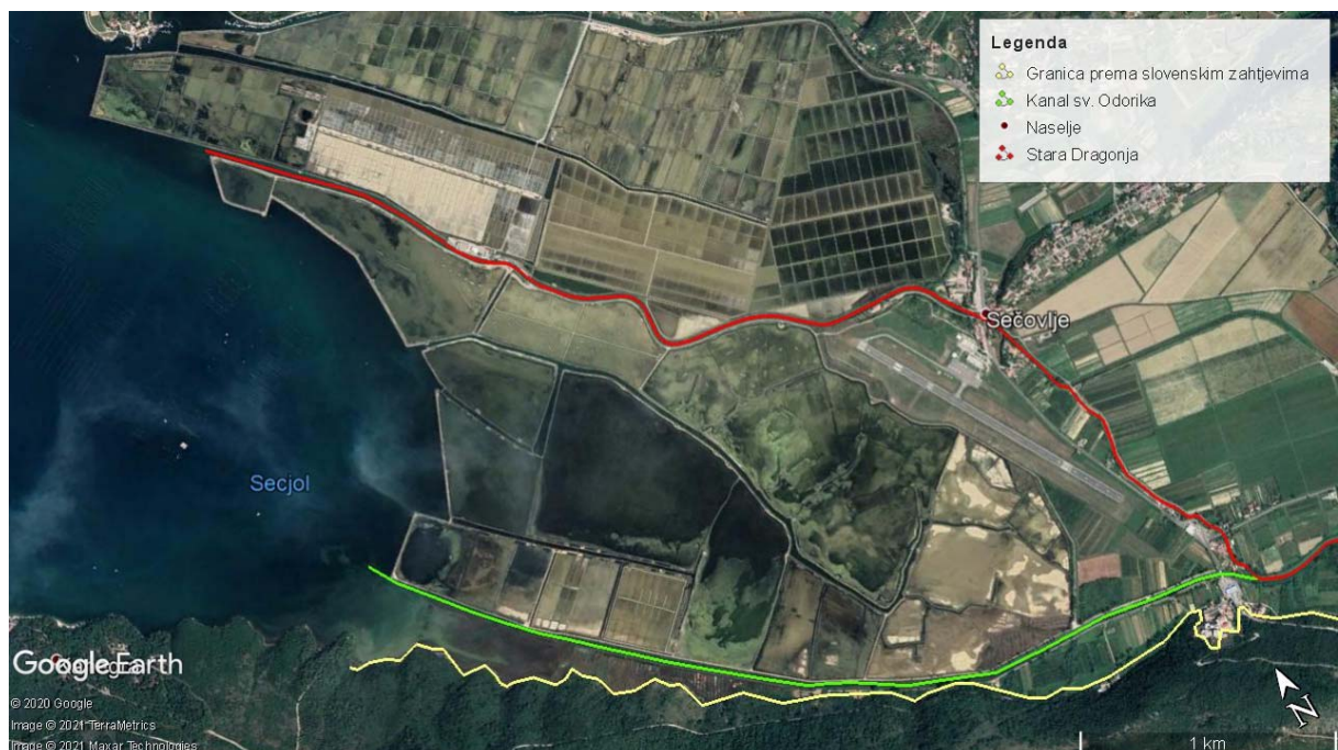
Slika 6. Prikaz spornog područja ušća Dragonje

Vezano za razgraničenje na rijeci Dragonji, osnovni je problem stav Slovenaca da hrvatsko-slovenska granica bude na Kanalu sv. Odorika pa čak i južnije od njega, dok Hrvatska smatra da bi granica trebala biti na rijeci Dragonji (Slika 6.). Naime, granica na rijeci Dragonji uspostavljena je još 1944. godine, no zbog čestih poplava dolazilo je do regulacija na njoj pa je prokopan Kanal svetog Odorika. S vremenom je Kanal preuzeo većinu vode od stare Dragonje tako da se od 1954. godine počeo smatrati graničnom linijom između Hrvatske i Slovenije. Kada bi slovenski zahtjevi bili prihvaćeni, Hrvatska bi osim površine s naseljima u spornom području, izgubila i ondašnje stanovništvo, a granica na kopnu bi utjecala i na povlačenje granice na moru, što bi ponovno bilo na štetu Hrvatske (Tomaić, Altić, 2013).