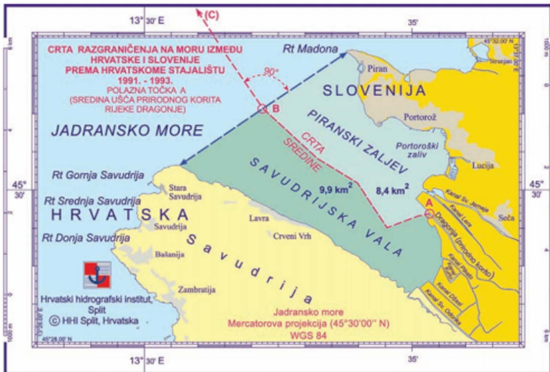
Slika 8. Razgraničenje na moru prema hrvatskim stajalištima (Gržetić i dr., 2010: 38)