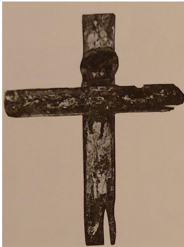
Slika 4. Slikano raspelo, crkva Sv. Križa u Splitu, prva polovina 13. stoljeća