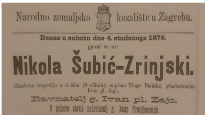
Slika 5 Poziv na Zajčevu operu u Zagrebu (A. SZABO, Hrvatski velikan Nikola Šubić Zrinski , 55.)

su se prijavile za natječaj objavljene su u kamenotisku pod nazivom Glazbeno Zrinska spomenica , kako bi bile dostupne javnosti. Također je, za 300. obljetnicu proslave, August Adelburg skladao operu Zrinyi . 100 Tada je napisana i poznata domoljubna pjesma U boj, u boj koju je napisao hrvatski književnik Franjo Marković. Stihovi ove pjesme uglazbljeni su u operu Nikola Šubić Zrinski skladatelja Ivan pl. Zajca, a ona je ujedno i najpopularnije hrvatsko glazbeno-scensko djelo. Zajčeva opera je prvi put izvedena 4. studenog 1876. godine u Zagrebu. Libreto za operu je napisao Hugo Badalić. 101 O važnosti ove opere u svrhu veličanja i odavanja počasti Nikoli Šubiću Zrinskom, svjedoči i podatak da je izvedena 1 317 puta. Osim što je opera bila najpopularnije djelo u cijeloj Hrvatskoj, postala je poznata u Europi i izvan nje. Poznata je čak u dalekom Japanu gdje se stihovi iz opere izvode kao himna muškog pjevačkog zbora kojom se odaje počast samurajskoj smrti junaka. Japanci su za napjev saznali 1919. godine kada su se hrvatski mornari nasukali pokraj Japana, vraćajući se u sastavu Austro-Ugarske vojske iz Sibira. Ondje su se zadržali u periodu od dva mjeseca i za to vrijeme su naučili lokalno stanovništvo pjesmu u boj, u boj! 102