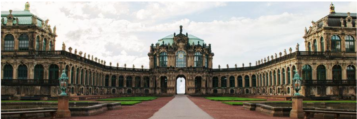
Slika 6. Zwinger mit Semperbau