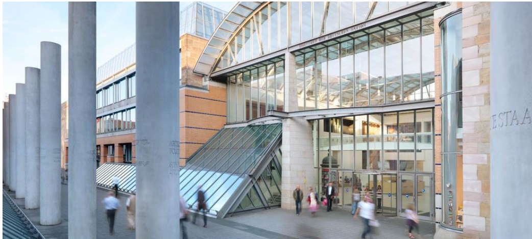
Slika 3. Germanisches National Museum