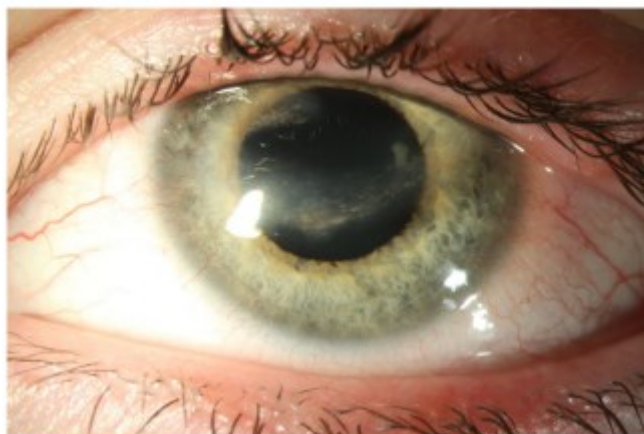
Slika 3. Okularna rozaceja kod djece (33)

Izvor: Tavassoli S, Wong N, Chan E. Ocular manifestations of rosacea: A clinical review. Clinical and Experimental Ophthalmology . 2021;49(2):109.