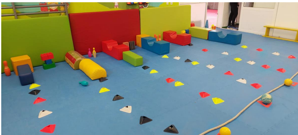
Slika 6. Primjer treninga na temu kuglanja

U gimnastici je glavna vježba, kao i što je u samoj tablici zapisana tema, kolut naprijed niz kosinu. Kosina se primjenjuje zbog potencijalne energije te kako bi sportaš imao više zamaha. Kod izvođenja koluta voditelj tj. trener mora cijelo vrijeme asistirati kako se ne bi dogodila ozljeda i kako se djetetu ne bi stvorio strah od izvođenja ove vježbe. Glavne točke kod koluta naprijed su sljedeće: glavu spuštamo dolje na prsa te ih brada cijelo vrijeme mora dodirivati, ukoliko se brada ne stavi na prsa, tijelo ne može izvesti vježbu jer nema oblik kuglice.