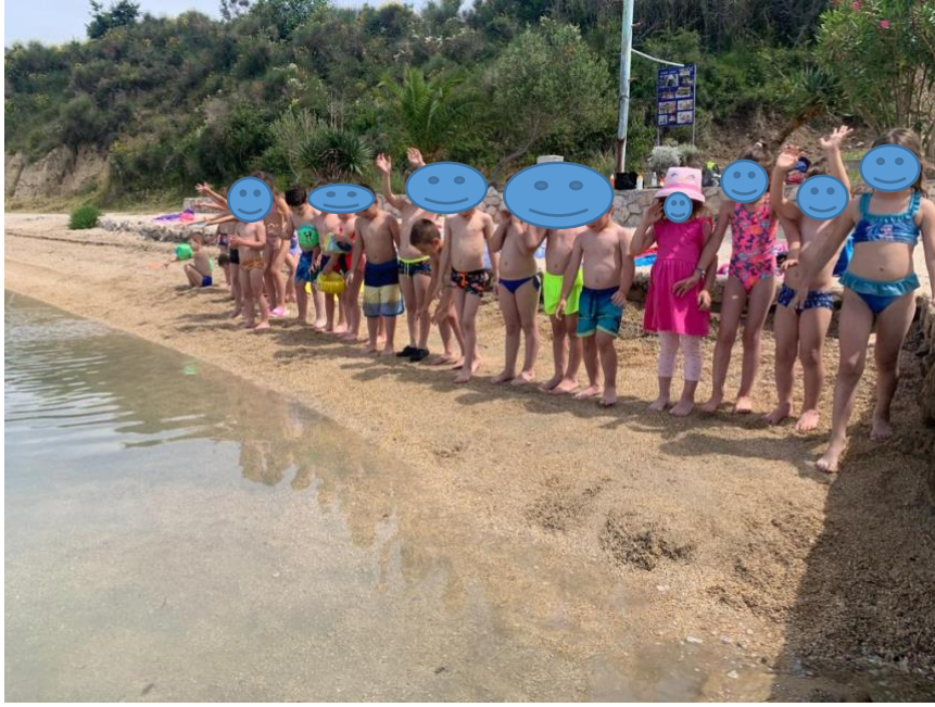
Slika 4. Ljetni kamp s „Lopticom“