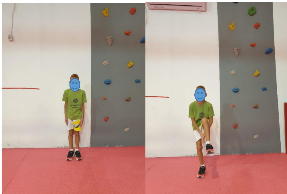
Slika 13. Vježba "Pljesak ispod noge"

UTJECAJ VJEŽBE: jačanje mišića cijelog tijela