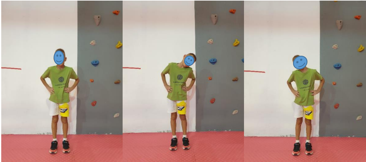
Slika 10. Vježba "Tik-tak"

UTJECAJ VJEŽBE: razgibavanje vrata i vratnih mišića