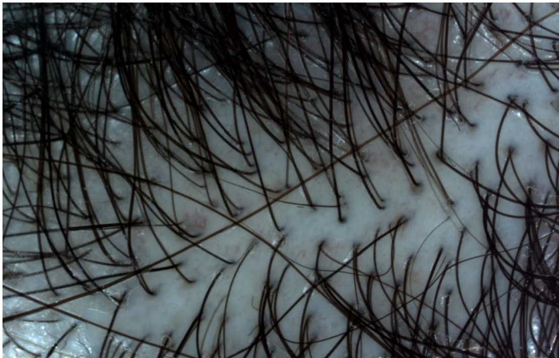
Slika 2B. Dermatoskopski je nalaz nespecifičan, iz većine folikula izlazi jedna dlaka, dlake su nejednolike debljine, vide se velusne dlake; novorastuće dlake imaju široku bazu i oštre su na distalnom dijelu.

(Prof. Zrinjka Paštar, MD, PhD, specialist of dermatology and venereology. Dentaderm. )