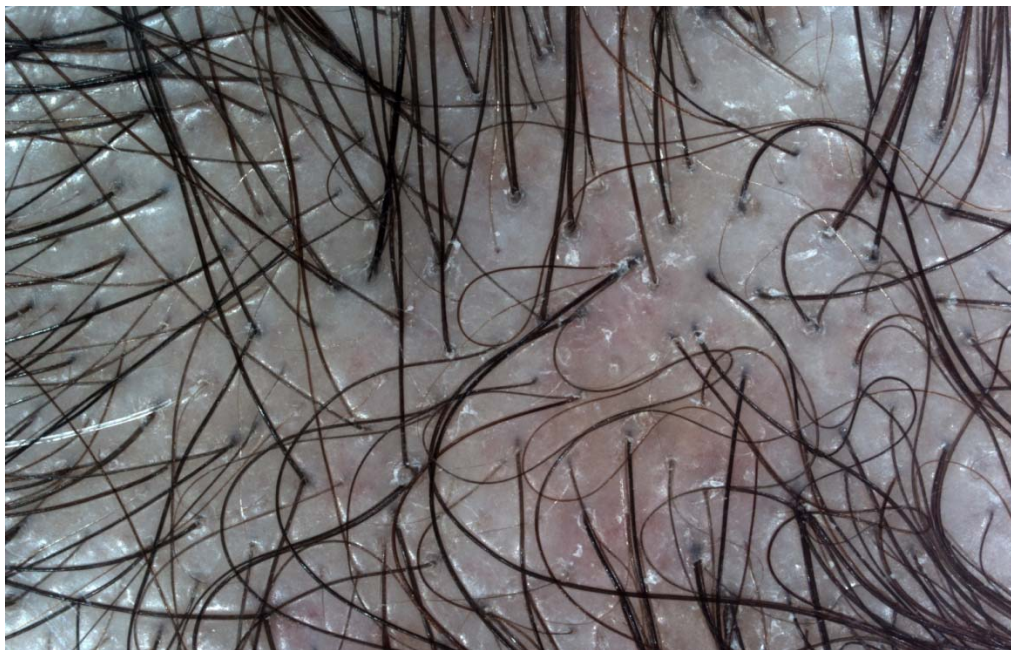
Slika 1B. Dermatoskopski se vidi anizotrihoza (različiti dijametri folikula), peripapilarna hiperpigmentacija, redukcija broja dlaka koji izlaze iz jednog folikula, žuti «dots» odnosno prazni folikuli ispunjeni sebumom. (Prof. Zrinjka Paštar, MD, PhD, specialist of dermatology and venereology. Dentaderm. )