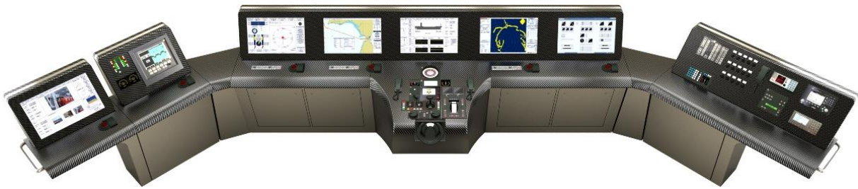
Slika 1. Integrirani navigacijski sustav – zapovjednički most