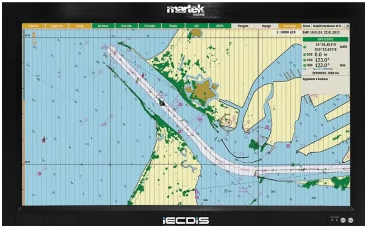
Slika 2. ECDIS