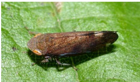
Slika 8. Fieberiella spp.

Vrsta veličine 6 do 8 mm, te se razvija na drvenastim biljkama. Biljke domaćini su vrste iz rodova Rosa i Prunus.