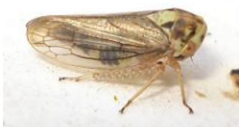
Slika 9. Macropsis spp.

Veličine od 4 do 4.2 mm, žućkaste boje, mjestimice smeđe.