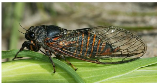
Slika 13. Cicadetta spp.

Nađen je samo jedan primjerak na lokalitetu Punta skala.