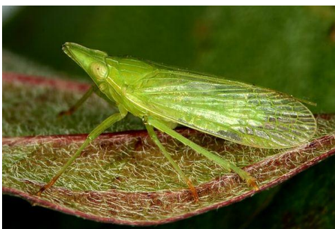
Slika 12. Dictyophara europaea L.

D. europaea je cvrčak zelene boje, veličine do 10 mm te je vrlo specifičnog izgleda.