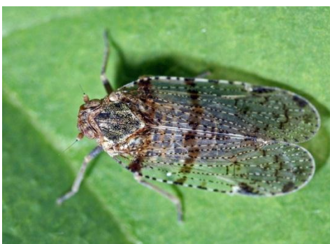
Slika 11. Cixius spp.

Vrste su veličine 6 do 8 mm. Glava je tamne boje dok je tijelo svijetlo sa tamnijim smeđim točkama.