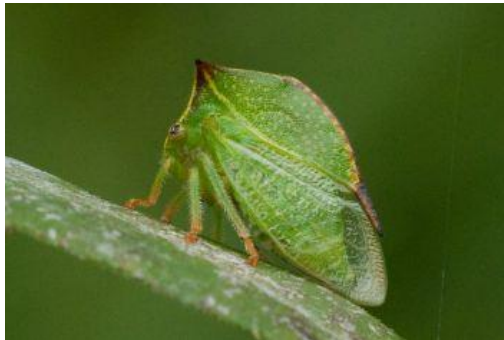
Slika 14. Stictocephala bisonia K. i Y.