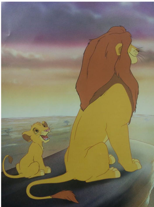
Slika 5: Mufasa poučava Simbu o krugu života, ( Kralj lavova , 2017)

Iako se ne radi direktno na tome, ovdje je prvi put dijete pripremljeno za smrt člana obitelji te razgovorom naučeno kako se to ponekad događa i kako je to normalna stvar. To se vidi u rečenici kada Mufasa svoga sina priprema na to da će i on jednoga dana umrijeti, a da će on sve naslijediti, ali da je takav krug života i da se to treba prihvatiti, a istoj stvari Simba poučava svoje dijete na kraju slikovnice: „Jednom će Simba prenijeti te iste riječi svome sinu... nastavljajući tako neraskidivi krug života.“ (Disney, 2017: 64).