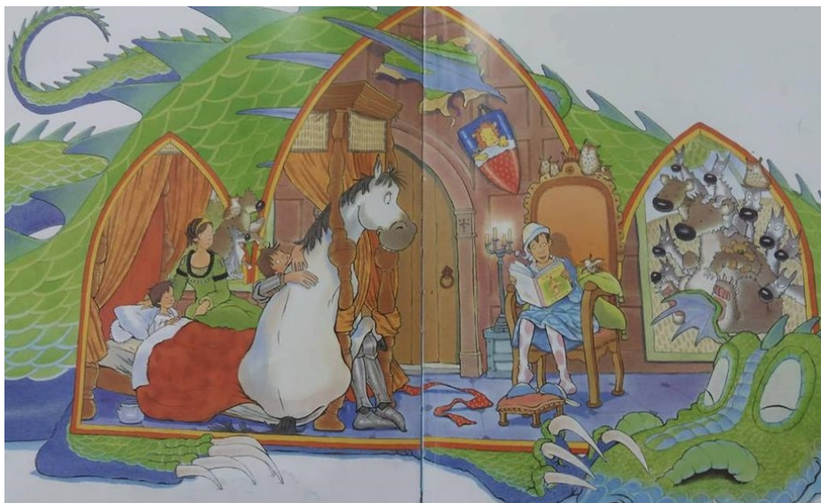
Slika 7: Otac, kralj, koji čita svome djetetu, ženi, vitezu i konju za laku noć ( Kraljevska pusa , 2002)

No, demokratski odnosi i humane vrijednosti koje prenosi otac ne staju ovdje: kako je vitez koji je išao po pusu putem nailazio na brojne nedaće, otac, kralj, odlučio je zajedno svima u sinovljevoj sobi pročitati priču za laku noć. U sobi su se nalazili majka, sin, otac, vitez i njegov konj. Samim primanjem viteza u kraljevićevu intimu i privatni prostor govori o tome kako se kralj odnosi prema podređenima s poštovanjem i uvažavanjem. Upravo se tu radi o humanim vrijednostima koje bi otac odgojem trebao prenositi na svoje dijete. Iako tu vrijednost otac ne prenosi intencionalno, on je prenosi svojim ponašanjem i bivanjem dobrim uzorom svome sinu, a svjesni smo kako djeca u vrlo ranoj dobi uče po modelu, odnosno oponašaju svoje roditelje, posebno one istoga spola/roda. Osim toga, otac je shvatio kako mora mijenjati temelje svoga očinstva jer vidi da to uzrujava njegova sina, on je odlučio da nikada više neće biti u žurbi, nego će imati vremena za svoju obitelj. To je potvrdio čitanjem svima za laku noć, a time je i promaknuo vrijednost provođenjem vremena sa svojom obitelji. „Te je noći kraljević bio sretan, i kraljica je bila sretna, a kralj je obećao da će prestati uvijek biti u žurbi.“ (Melling, 2002: 25).