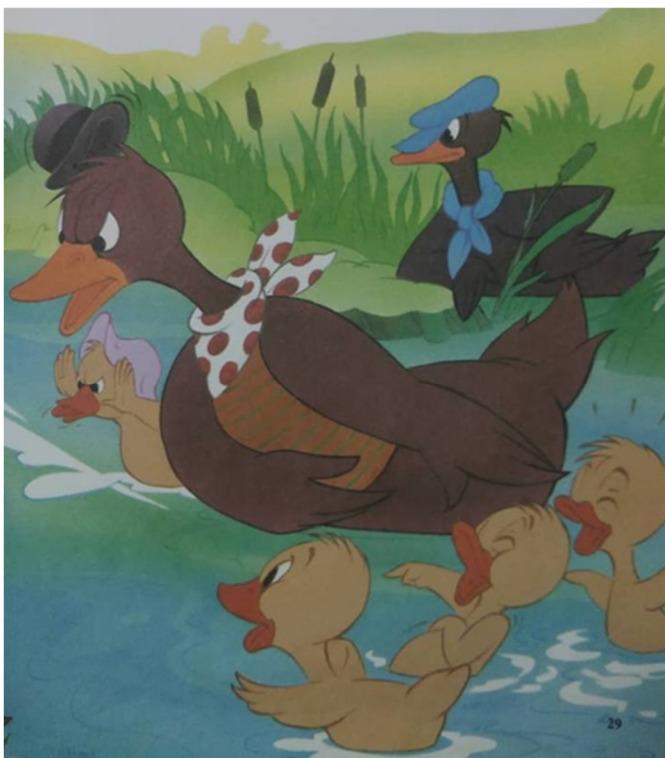
Slika 1: Prikaz obitelji iz slikovnice Ružno pače (1994), 29. str.

Osim tog oblika obitelji, koji predstavlja glavne likove u ovoj priči, na ilustraciji u slikovnici na 29. str. pojavljuje se još jedna obitelj pataka koja je ovaj put potpuna, a sastoji se od majke patke označena bijelo crvenom maramom oko vrata, dok je otac prikazan u pozadini, kao pasivan u dječjoj okolini s plavom kapom i maramom oko vrata. Ta obitelj imala je i tri sina čiji spol nije bio nikako označen, ali je prepoznat po tome što su imali sestru koja je nosila roza kapicu na glavi. Čak i u ovoj situaciji, gdje je na ilustraciji prikazana potpuna obitelj majka se čini kao primarna odgajateljica, jer je prikazana u blizini djece te komunicira s Ružnim pačetom kojeg je tada možda smatrala prijatnjom za njenu djecu, dok je otac pasivan u pozadini.