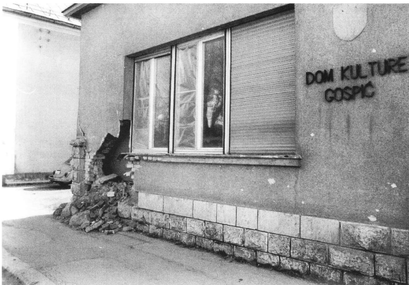
Slika 2. Gradska knjižnica Gospić

od 60 000 knjižnih jedinica i 4000 audio i video zapisa u odnosu na prijeratnih 23 771 svezak knjiga.