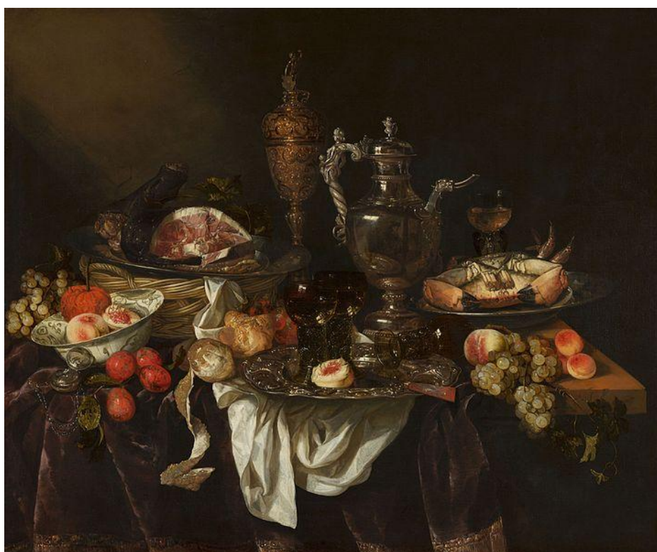
Prilog 18. Abraham van Beijeren, Banquet s autoportretom slikara na srebrnom vrču, 1655.-1665.