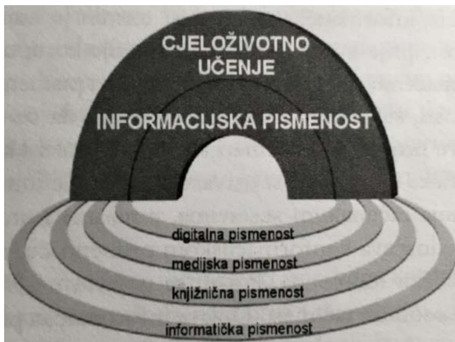
Slika 1. Odnos informacijske i drugih suvremenih pismenosti