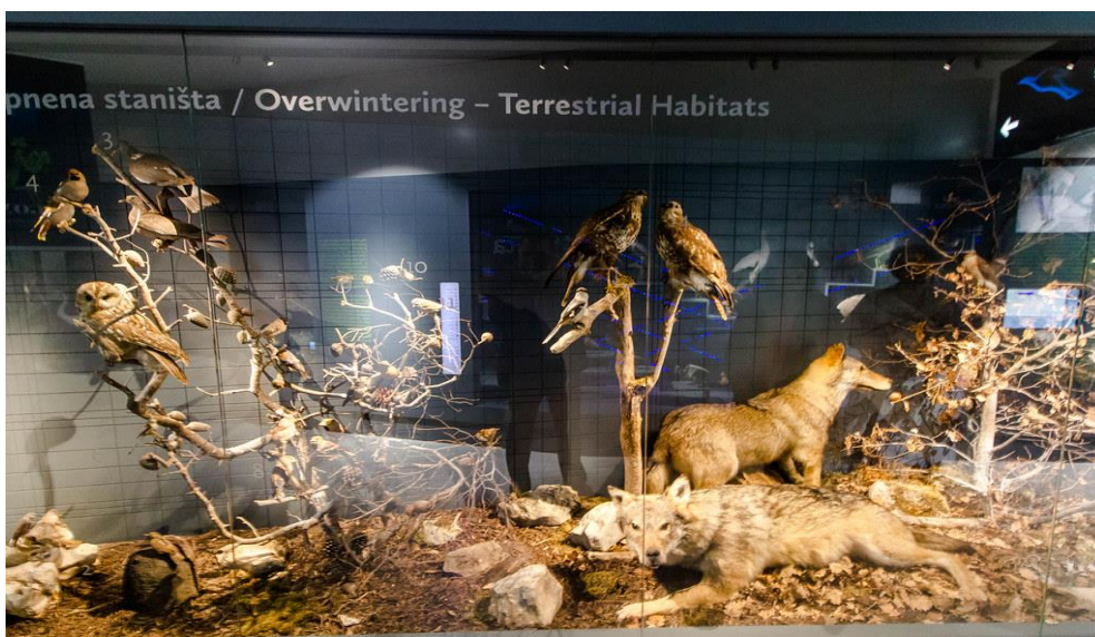
Slika 11. Kopnena staništa