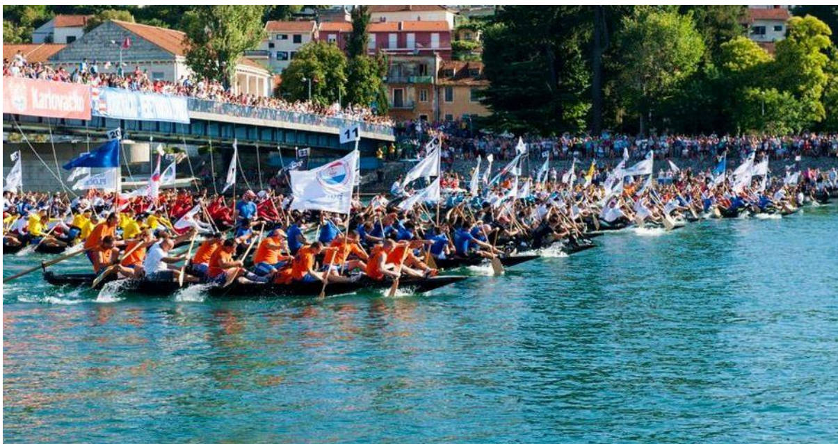
Slika 15. Maraton lađa