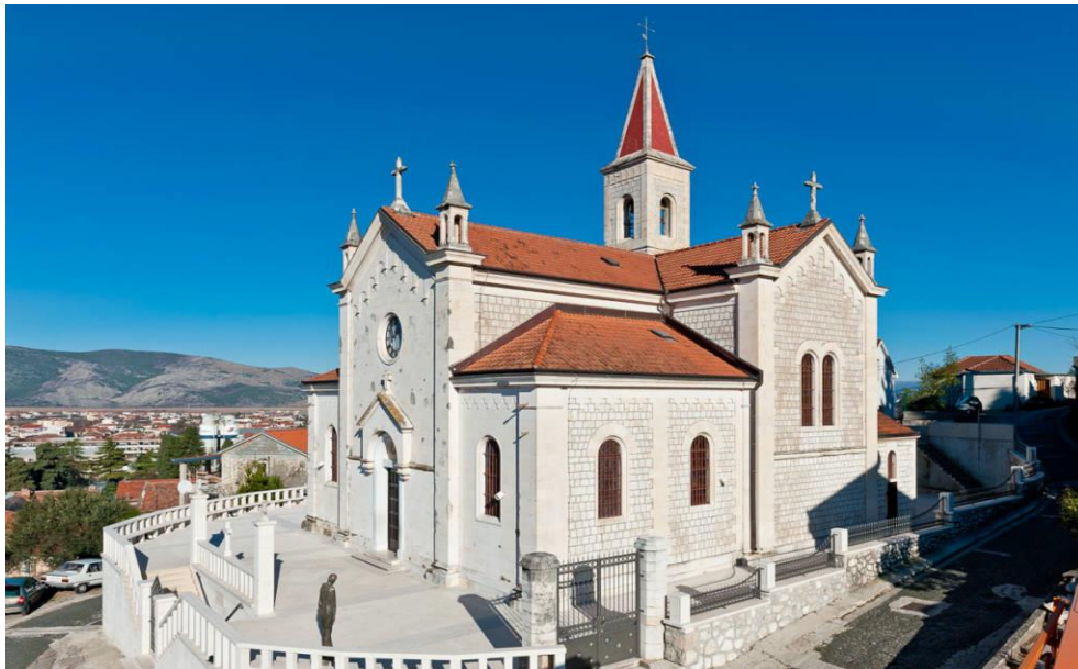
Slika 8. Crkva sv. Ilije, Metković

Pisani izvori tvrde da je crkva sv. Ilije (Sl. 8) podignuta krajem 17. stoljeća ili početkom 18. Crkva je dva puta proširivana zbog potrebe za većim prostorom. Na istočnom zidu, pri samom vrhu smješten je prozor elipsoidnog oblika, koji je karakterističan za europski barok iz 17. i 18. stoljeća. Što se tiče stila, crkva sv. Ilije pripada historicizmu, koji se nakon 1860. javlja u Dalmaciji. Iako su se javljala nova tehnološka dostignuća i otkrivali se novi građevinski materijali, gradnja je ipak okrenuta u prošlost. Sakralnoj arhitekturi su podobni neoromanika i neogotika s obzirom da su bili oduševljeni srednjim vijekom kao i religijskim zanosom novog stila romantizma. Primjećuje se da crkva ima bazilikalni karakter, ali središnji brod nije veći od bočnih pa je bazilikalno osvjetljenje izostavljeno. Prozori crkve su polukružni i raspoređeni su uzduž bočnih zidova. Svi elementi crkve karakteristični su za neoromaniku. Izgradnja crkve dovršena je 1874. godine, a godinu dana kasnije javni sat postavljen je na zvonik (Vekić, Volarević, 2016).