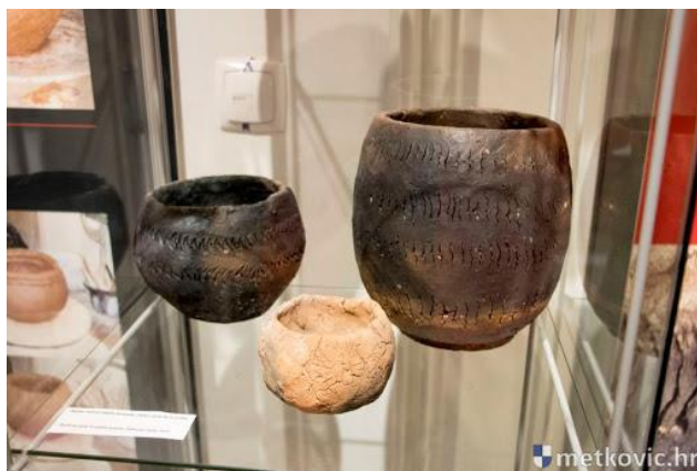
Slika 10. Keramičke posude