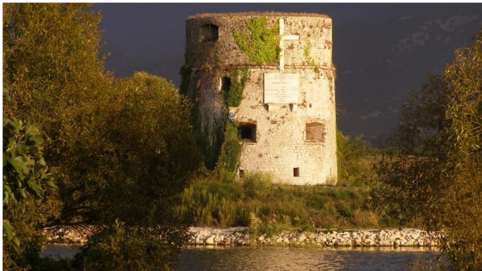
Slika 6. Kula Norinska

Poznati osmanski putopisac, Evlija Čelebi (17. stoljeće), opisuje Kulu kao utvrdu sa sedam katova koja je imala pristanište za brodove, džamiju i skladišta za hranu i oružje. Priča o kuli kao utvrdi sa sedam katova, koji su nestali i potonuli u močvari, prepričavala se usmenom predajom. Kula je puno puta stradala u mletačko-osmanskim ratovima, a bila je i minirana od strane Mlečana, pa je bila obnavljana više puta. Zato se smatra da cijela građevina datira iz 17. stoljeća, tj. sa samog kraja s obzirom da su vidljive karakteristike načina gradnje i stila te se ne uočavaju oštećenja koja su se navodila u povijesnim izvorima. Kula norinska građena je od opeke i klesanog zida. Danas je vidljivo da je to monumentalna kružna kula koja ima profilaciju na vanjskom dijelu plašta, zidove debljine oko 2 metra, raščlanjena je dubokim prozorima koji su služili za topove, što karakterizira mletačku arhitekturu 17. stoljeća (Vekić, Volarević 2016).