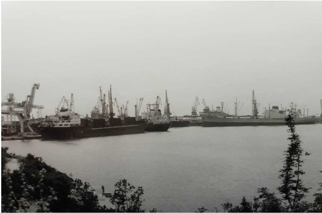
Slika 3. Brodovi usidreni u luci Ploče