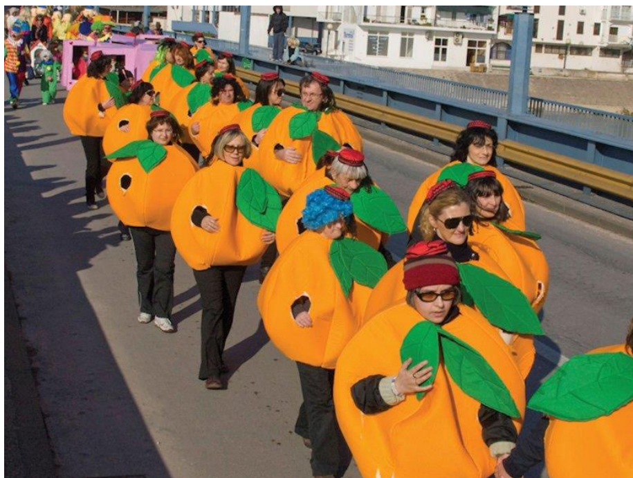
Slika 17. Pokladna povorka