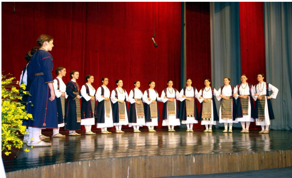
Slika 12. KUD Metković

Dubrovačko-neretvanskoj županiji. Smotra nema natjecateljski karakter, ali svaki nastup prati Programsko vijeće koje u svom sastavu ima najpoznatije hrvatske muzikologe i etnologe te folkloriste koji ocijene svaki nastup, kako bi se što bolje prezentirala i promovirala hrvatska narodna baština (URL 19).