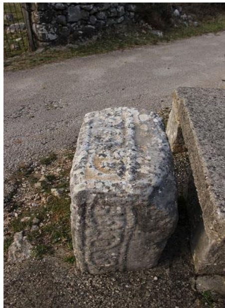
Slika 4. Crkva Male Gospe, Dobranje

Osim spomenutih, važno je istaknuti i lokalitet Grebine, koji se nalazu u blizini Ploča gdje je pronađeno postojanje 8 kamenih gomila i 22 stećka. Od 22 spomenika, 4 su amorfna spomenika, 18 ih je obrađeno u cijelosti ili djelomično. Na Grebinama se nalaze niži oblici stećaka, čija je visina većinom od 20 do 45 centimetara (Šunjić, 2009).