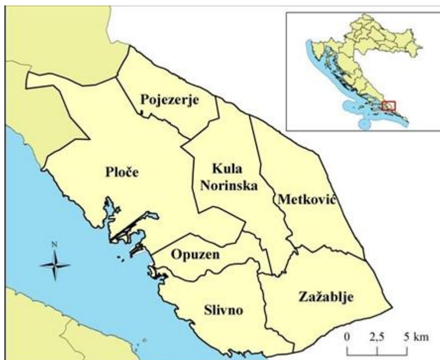
Slika 2. Jedinice lokalne samouprave u Donjem Poneretavlju

S obzirom da je riječ o fizionomskoj regiji čije granice, a ni sam naziv, nisu u potpunosti definirane, područje istraživanja je određeno na lokalnoj razini na temelju upravno-teritorijalnog ustroja Republike Hrvatske. Donjoneeretvanski kraj se sastoji od sedam jedinica lokalne samouprave (Sl. 2), tri grada: Metković, Opuzen i Ploče te četiri općine: Kula Norinska, Zažablje, Pojezerje i Slivno (Tabl. 1). Površina područja iznosi 412,56 km 2 , što je ukupno 23,15% površine Dubrovačko-neretvanske županije. Veći dio područja smješten je u unutrašnjosti kopna, a dijelovi gradova Opuzena, Ploča i općine Slivno su primorski. Najnaseljenija područja Donjoneeretvanskog kraja su gradovi Metković, Opuzen i Ploče, a najslabije su naseljene općine Kula Norinska, Slivno, Zažablje i Pojezerje (Polić i dr., 2016).