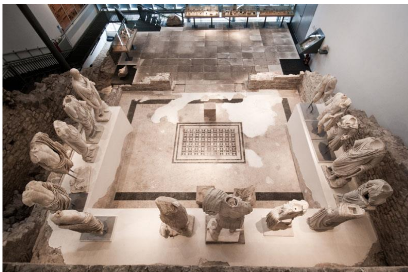
Slika 9. Pogled na Augusteum