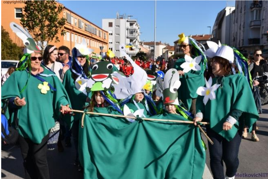
Slika 16. Pokladna povorka

učenici žele sudjelovati i u kojima mogu povezati likovnost i baštinu. Učenici komentiraju kostime ostalih učenika i hvale njihov rad i trud. Pitamo učenike ima li nešto što bi drugačije napravili u ovom projektu, potičemo ih da kritički zaključuju i daju svoje prijedloge.