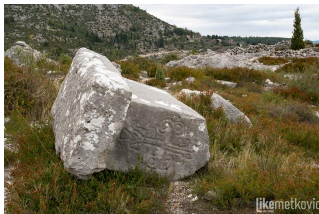
Slika 5. Slivno – Prović