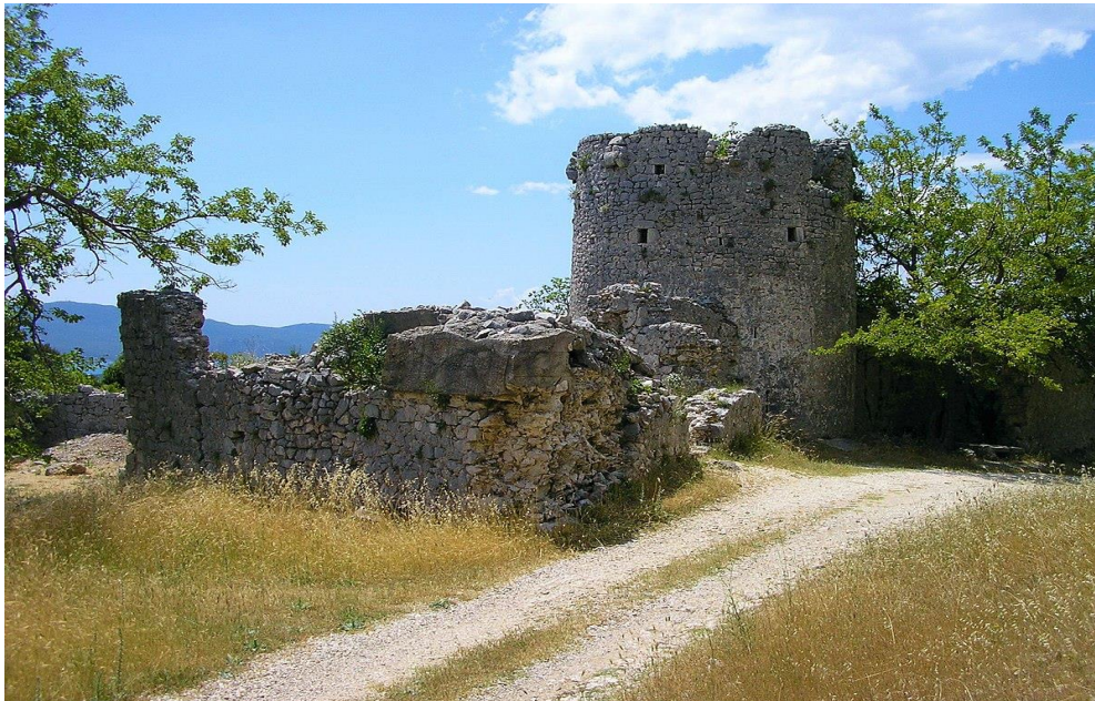
Slika 7. Smrdan grad

Ruševne zidine Smrdan-grada (Sl. 7) nalaze se iznad Kleka. Utvrda koju i danas možemo vidjeti, trokutastog je oblika i ima bedeme koji se prostiru oko 50 metara sa svake strane. Sagrađena je krajem 17.stoljeća, točnije 1689.godine kada grad od Turaka preuzimaju Mlečani. Uz južni bedem smještena je crkva sv. Roka, jednobrodna građevina koja ima zvonik na preslicu i pravokutnu apsidu (URL 9). Povijest Smrdan-grada usko je povezana i za povijest Neretvana i njihove hrabrosti pred Turcima. Jednom su prilikom, pokušavajući opsjesti grad, Turci pretrpjeli stravične gubitke. Njihova mrtva tijela ostala su ležati na samom ulazu u grad te se osjetio jaki smrad i to je navelo stanovništvo da utvrdu iznad Kleka nazovu Smrdelj ili Smrdan grad (URL 10).