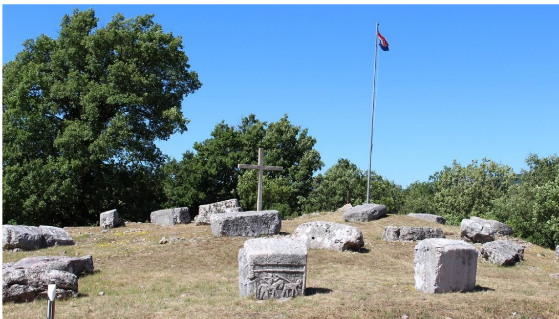
Slika 18. Stećci

Nakon povratka u školu razgovaram s učenicima o kulturno-povijesni spomenicima i prisjećamo se što smo sve vidjeli u Borovcima. Učenici su razvili svijest o bitnosti provođenja zavičajne nastave i žele da se ovakvi projekti nastave i dalje. Zavičajna nastava ima širok spektar tema i učenike potiče na razmišljanje i kreativnost te da na taj način samostalno uče. Razgovaramo o idućim temama projekta pomoću kojih bi učenici pobliže upoznali svoj zavičaj i iznose svoje ideje.