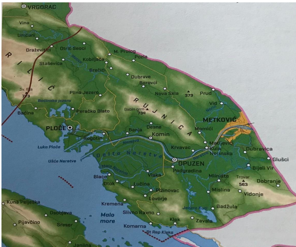
Slika 1. Donje Poneretavlje

Područje Donjoneretvanskog kraja u znanstvenoj literaturi još nije dobilo jedinstveni naziv. U 18. stoljeću fra Andrija Kačić-Miošić i fra Luka Vladimirović to područje nazivaju Neretvanska krajina . Trpimir Macan (kao i Damir Magaš, koji naknadno usvaja taj naziv) navedeno područje naziva Donjim Poneretavljem (Sl. 1), Zoran Curić Donjoneretvanskim krajem , Martin Glamuzina Deltom Neretve , a Jakša Raguž Hrvatskim Poneretvljem . U novinskim se tekstovima najčešće koriste imena Neretvanska dolina i Dolina Neretve , dok stanovnici ovaj kraj najčešće nazivaju Donjom Neretvom ili Neretvom . Vidović u svojim radovima navedeno područje naziva Neretvanskom krajinom budući da je riječ o povijesno i terenski potvrđenom imenu. Druga bi imena i nazivi područja bila neprikladna za uporabu jer su višeznačna (Vidović, 2013).