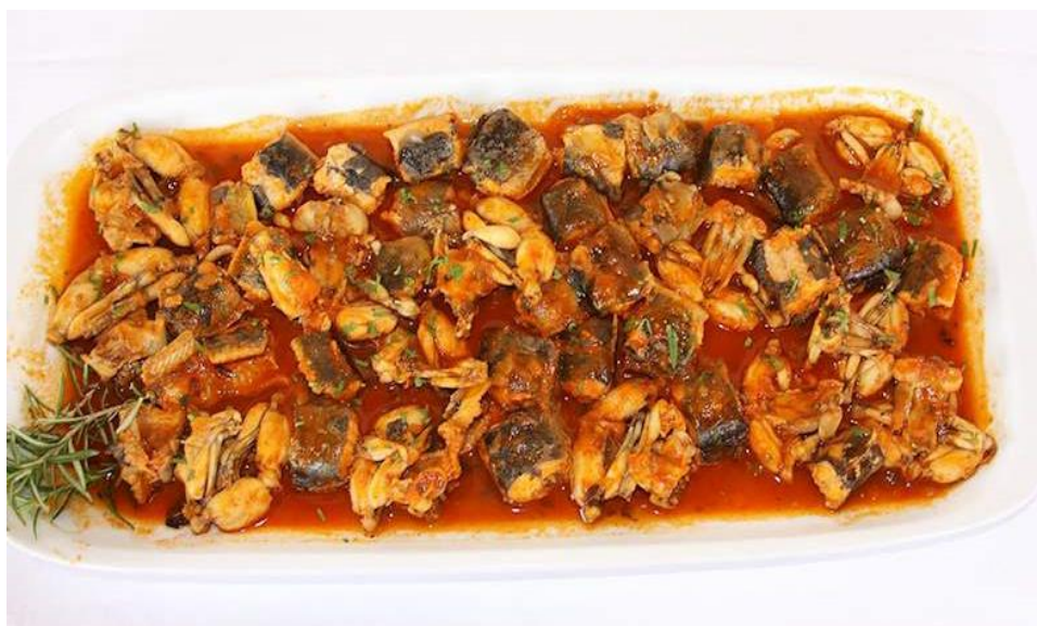
Slika 14. Neretvanski brodet

Kulturno-zabavne priredbe može nadopuniti privlačna gastronomska ponuda. Neretvanska kuhinja koja je obogaćena autohtonim specijalitetima (žablji kraci, ptice, ribe, jegulja), koji su pripremljeni na raznovrsne načine, dobro su poznati i izvan granica donjoneretvanskog kraja. Uz bogatu gastronomsku ponudu, treba istaknuti domaća neretvanska vina vinarije (Prović, Rizman, Volarević), od kojih su neka vina nagrađena na inozemnim i domaćim sajmovima. Otkrivanje neretvanskih zanimljivosti sigurno će biti razlogom za ponovni povratak u slikoviti kraj Hrvatskog primorja (Curić, 1994).