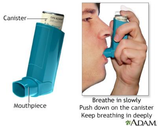
Slika 1. Inhaler aerosolom