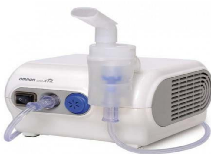
Slika 3. Nebulizer ili elektroraspršivač