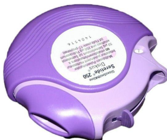
Slika 2. Diskus s praškom za inhalaciju, Izvor: https://leki-opinie.pl/seretide