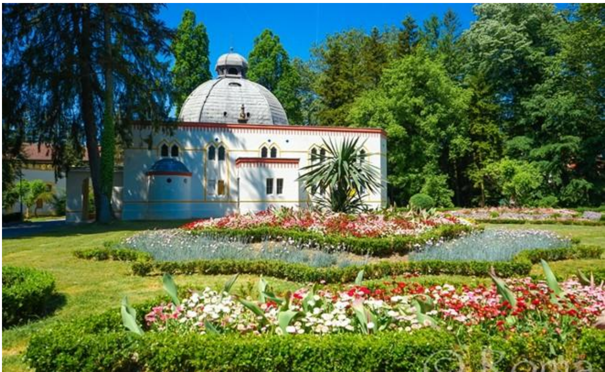
Slika 3: Centralno blatno kupalište

http://www.visitdaruvar.hr/ljecilisni-perivoj-julijev-park.aspx