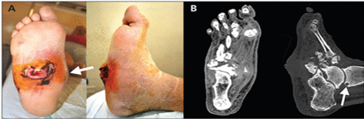
Slika 1. (A) Desno stopalo (plantarni i bočni pogled) 59-godišnjeg muškarca s dijabetičkom neuropatijom koja pokazuje kolaps unutarnjeg luka (strelica) i veliki neuropatski ulkus na srednjoj površini stopala. (B) Kompjuterizirane tomografske slike (dorzo-plantarni i lateralni prikazi) pacijentovog desnog stopala pokazuju subhondralnu cistu (strelica), fragmentaciju, dezorganizaciju i gubitak normalne arhitekture talusa, kalkaneusa, tarzalnih kostiju i baza metatarzalnih kostiju.