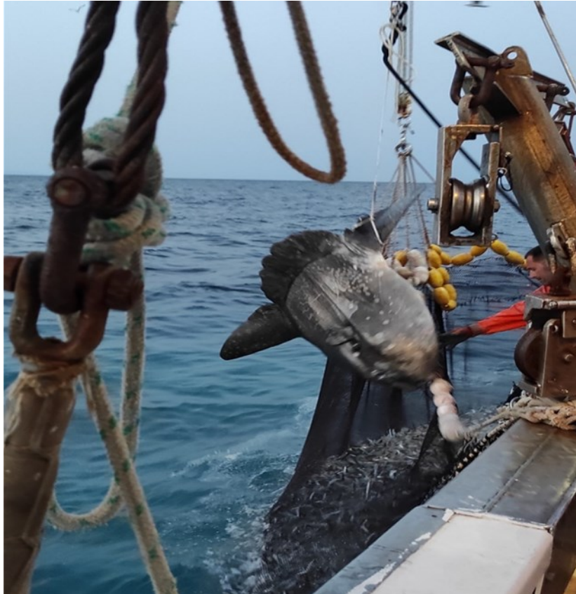
Slika 2. Veliki bucanj ( M. mola ) u prilovu

Tablica broj 3. prikazuje kako su se u 83 evidentirana ribolovna dana ulovila 2 goluba uhana (slika 3), 1 žutuga ljubičasta i 5 glavatih želvi. Morske ptice nisu evidentirane u prilovu, dok su morski sisavci zabilježeni u interakciji s ribolovnim alatom bez da su ulovljeni kao prilov.