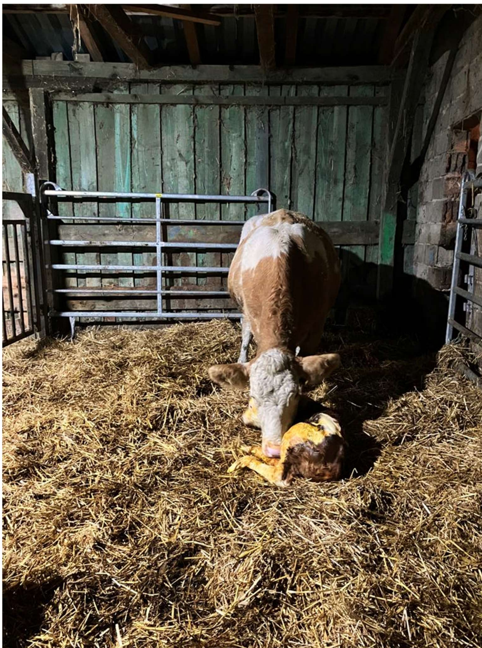
Slika 3. Krava s novorođenim teletom u pojedinačnom odjeljku, na dubokoj stelji

Raspored teljenja djelomično je sezonski, na način da se većina teljenja odvija u razdoblju od ožujka do lipnja, zbog lakše prodaje teladi, ali teljenja su prisutna tokom cijele godine, izuzev prosinaca i siječnja. Stado je uvijek podijeljeno u manje skupine, obzirom na stadij proizvodnje u kojem se goveda nalaze. Na gospodarstvu se provodi gotovo isključivo prirodni pripust licenciranim bikovima simentalске pasmine, iz uvoza ili vlastitog uzgoja.