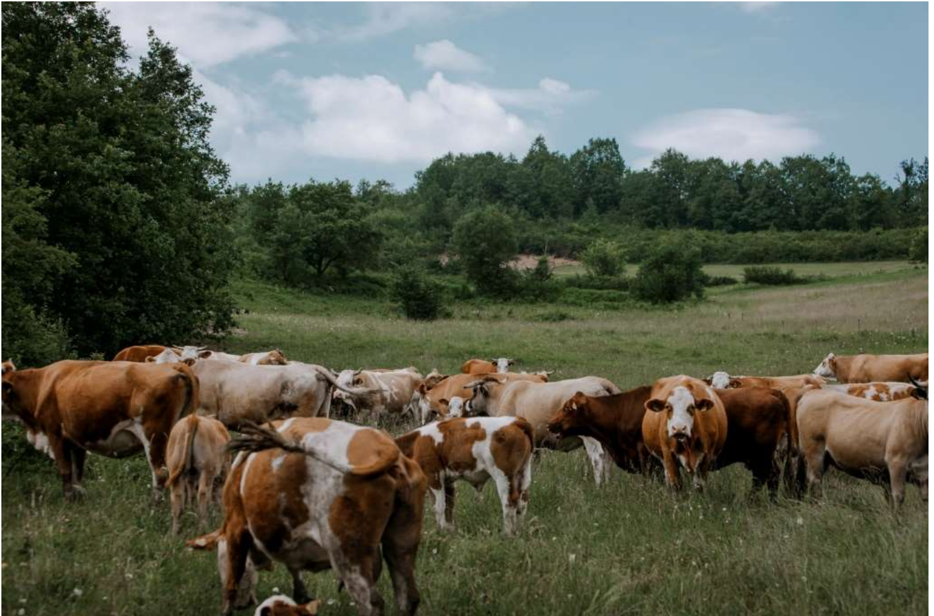
Slika 2. Simentalske krave s teladi na ispaši

veterinarskoj dijagnostici, izbor parametara koje analiziramo također mora biti svrsishodan, ravnajući se uz to prema anamnezi i provedenom kliničkom pregledu (BOUDA i JAGOŠ, 1984).