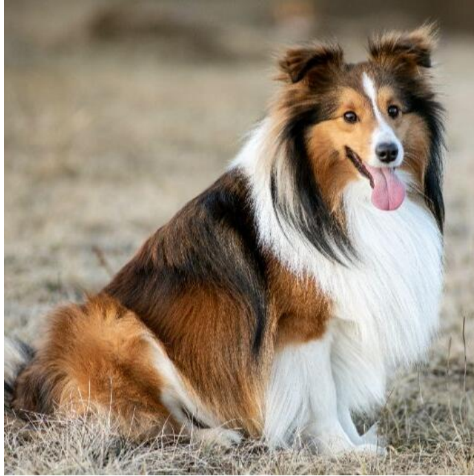
Slika 4 Šetlandski ovčar