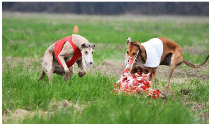
Slika 13 Lov hrtova na umjetni mamac

U ovoj disciplini nema žrtava ni lovine jer se lovi umjetni mamac (Slika 13) koji je građen od skupa plastičnih traka pričvršćenih za užu koje skreće preko kolotura postavljenih na travnatoj površini. Staza treba biti dinamično postavljena da kretnja mamca, koja simulira trk divljači, oponaša pravi lov. Duljina staze je 600 m. Psi na taj način zadovolje svoj lovni nagon, istrčavanjem se riješe velike količine energije, ali i jačaju agilnost, inteligenciju i snalažljivost. Na natjecanju psi trče dvije različite utrke (vožnje) u paru gdje uče međusobno surađivati. Svaka vožnja ima drugačiju putanju mamca što zahtijeva inteligenciju i timsku suradnju pasa. Sudac boduje svaku vožnju, te se na kraju određuje konačan poredak pasa. Ukoliko pas tijekom lova izgubi mamac iz vidnog polja, promatra se na koji način se ponovno vraća u lov te sudac boduje njegovu težnju za nastavkom utrke. Ujedno se tijekom utrke stavlja naglasak na međusobnu komunikaciju pasa. Psi ne smiju ometati jedan drugoga niti pokazivati agresivnost. Na natjecanju se ne mjeri vrijeme već se prate karakteristike poput agilnosti, izdržljivosti, praćenje mamca, želja za lovom i brzina jednog psa prema drugom (GREGL, 2018.).