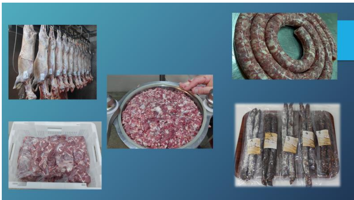
Slika 6. Inovativnost i kreativnost inovativnog proizvoda od inovativne janjetine HRZZ projekta “Inovativni funkcionalni proizvodi od janječeg mesa“ (IP-2016-06-3685) u stupnju razvoja funkcionalnog laboratorijskog prototipa.