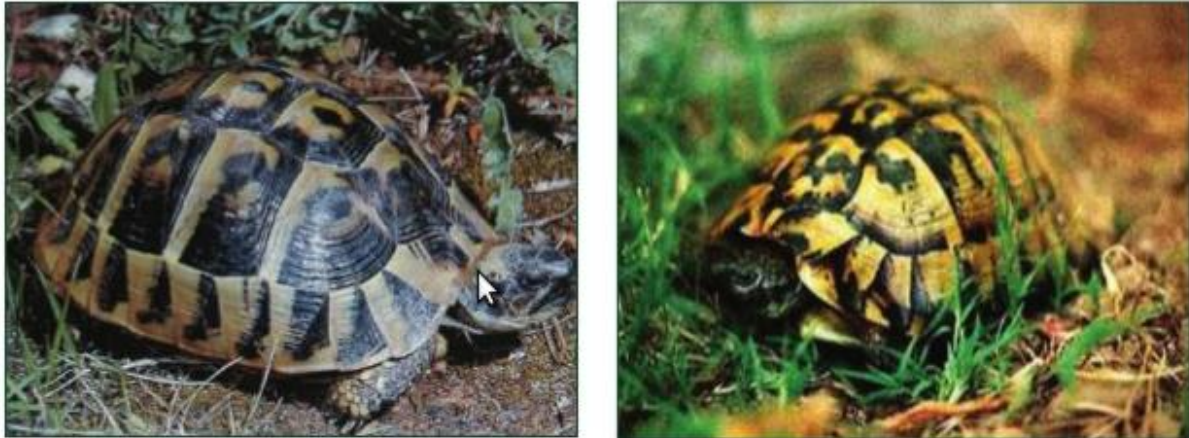
Slika 1. Obična čančara (MATAŠIN i sur., 2007.)

Prema zakonu o zaštiti životinja i pravilniku o zaštiti divljih svojti zabranjeno je uznemiravanje, uzimanje iz prirode kornjača ili njenih jaja i prodaja istih, kao i uništavanje staništa, obitavališta i gnijezda ili legla, te prodaja, kupnja ili pribavljanje na bilo koji drugi način, kao i prepariranje ovih životinja (ANON, 2006).