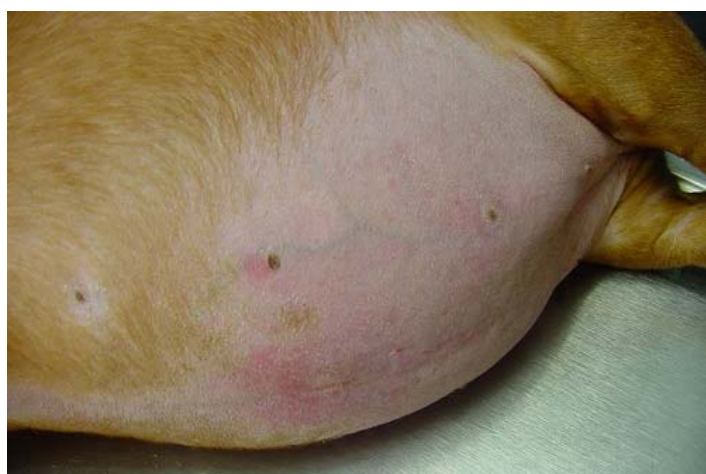
Slika 2. Proširen abdomen psa s alopecijom i tankom kožom te vidljivim krvnim žilama.

Kod ljudi bolest se, najčešće, javlja u žena srednjih godina s nalazom pretilosti trupa, pojačane obraslosti dlakama te povišenim krvnim tlakom. Intolerancija na glukozu je česta. Pacijent je slab, sklon zadobivanju masnica i emotivno lako uznemiren. Dobiva na tjelesnoj masi, ali primarno u području trupa i to s pojavom crvenih strija na koži.