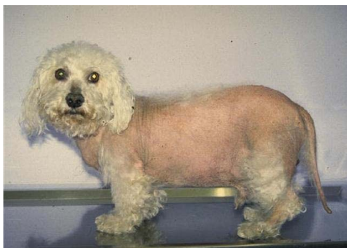
Slika 1. Alopecija u psa s Cushingovim sindromom.