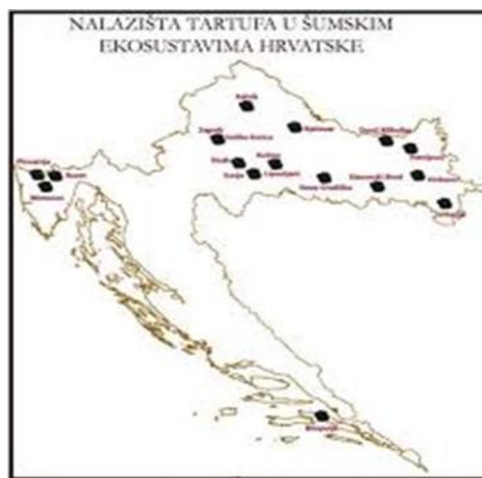
Slika 1 Nalazišta tartufa u Republici Hrvatskoj

U sezoni 2018. tijekom 12.mjeseca autor je osobno istražio kontinentalne dijelove Republike Hrvatske u potrazi za bijelim i crnim tartufom. Pronađen je bijeli tartuf ( T.