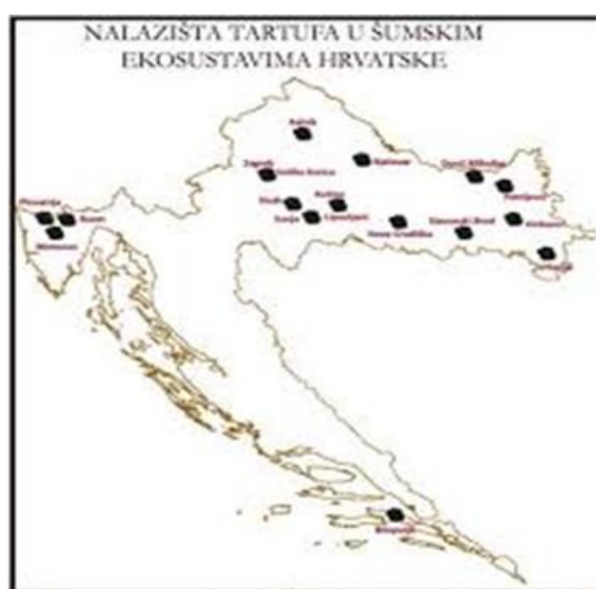
Slika 1 Nalazišta tartufa u Republici Hrvatskoj

U sezoni 2018. tijekom 12.mjeseca autor je osobno istražio kontinentalne dijelove Republike Hrvatske u potrazi za bijelim i crnim tartufom. Pronađen je bijeli tartuf ( T.