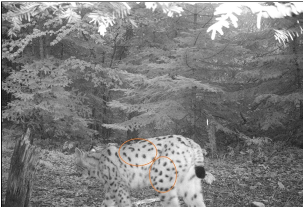
Slika 3. Fotoidentifikacija risa prema specifičnom pjegastom uzorku.

Fotoidentifikacija risa temelji se na usporedbi uzorka pjegaste pigmentacije krzna na fotografijama iste strane tijela. Identifikacija se izvodi postavljanjem dviju fotografija jednu uz drugu te traženjem podudaranja (Slika 3. i Slika 4.).