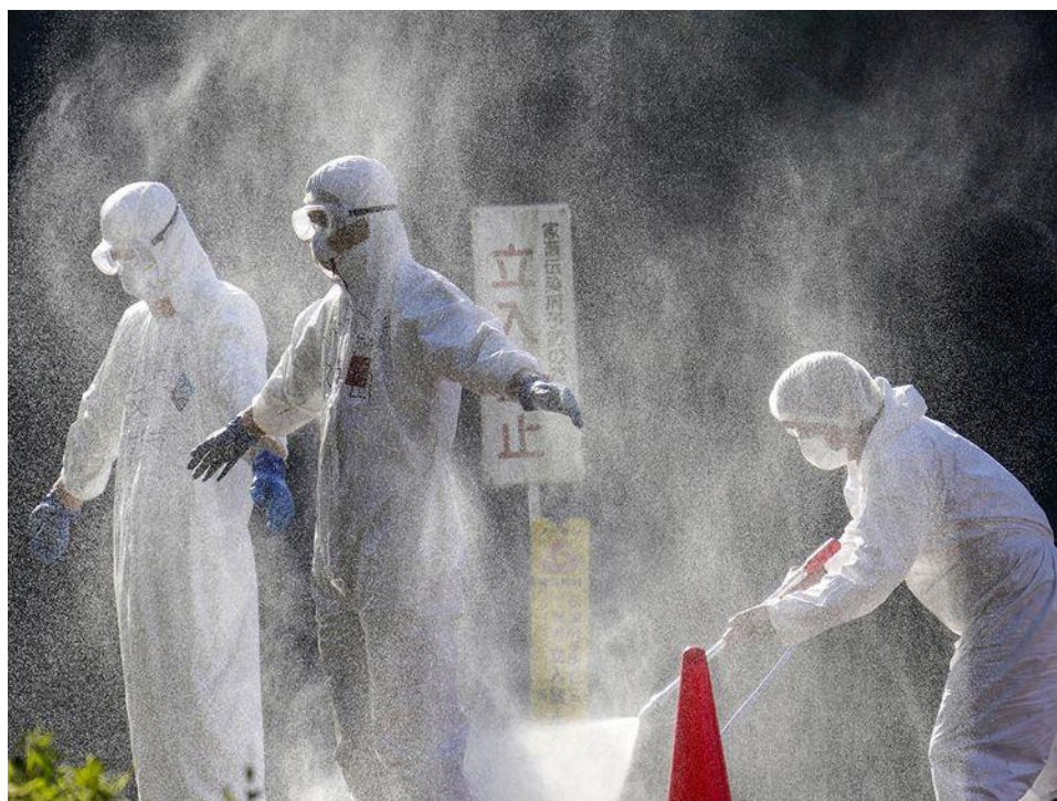
Slika 6. Dekontaminacija zaštitnih odijela.

jednokratne zaštitne opreme, ili posuda s dezinficijensom za višekratnu zaštitnu odjeću koju je prvotno potrebno oprati vodom i deterdžentom kako bi se uklonila velika onečišćenja koja mogu oslabiti učinkovitost dezinficijensa (slika 6). U slučaju da se na gospodarstvu tijekom sumnje na izbijanje bolesti nalaze neslužbene osobe, one se moraju popisati, po mogućnosti presvući, otuširati i pričekati službenu procjenu rizika. U eventualnom nedostatku odobrenih dezinfekcijskih pripravaka moraju odjeću dezinficirati domaćim preparatima poput natrijevog karbonata pomiješanim s vodom u omjeru 1:10, sapunom i vrućom vodom te kućanskim izbjeljivačem (CAPUA i ALEXANDER, 2009.).