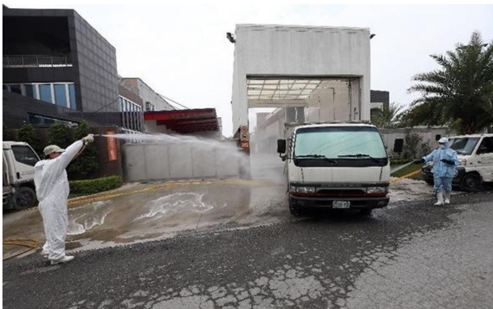
Slika 9. Čišćenje i dezinfekcija vanjskih dijelova vozila.