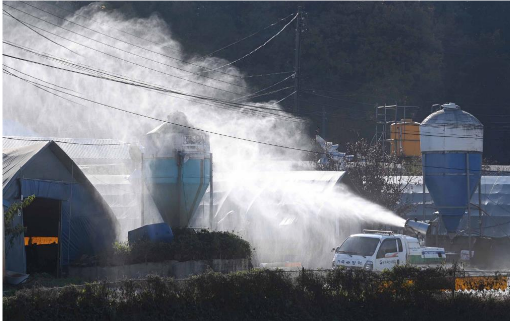
Slika 8. Potpuna dezinfekcija peradarskih objekata.