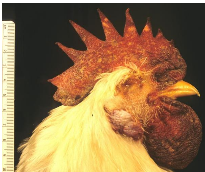
Slika 3. Hemoragije i nekroza krijeste.