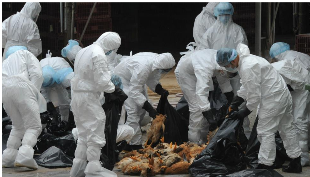
Slika 7. Uklanjanje lešina preventivno zaklane peradi.

provodi zakapanjem ili odvozom u kafilerije (slika 7). U područjima gdje se zakapanje smatra prigodnim, iskopana rupa mora biti barem 2 metra duboka i široka što omogućuje zakapanje cca. 300 jedinki s prosječnom težinom od 1,8 kg. Lešine se potom prekriva slojem kalcijevog hidroksida i slojem zemlje od minimalno 40 cm debljine. Pri prijevozu u kafileriju, vozilo mora osigurati nemogućnost istjecanja sadržaja u okoliš (IZSVe, s.a.).