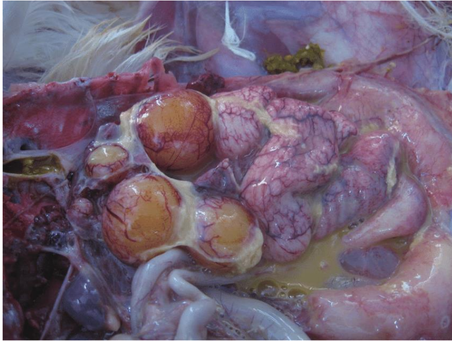
Slika 1. Peritonealna šupljina s tekućim žutim sadržajem i upalnim promjenama uzrokovanim egg-peritonitisom .