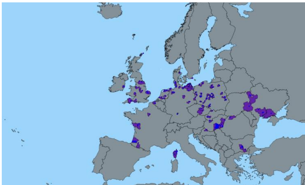
Slika 4. Potvrđeni slučajevi VPPI u peradi u Europskoj uniji tijekom 2020. godine.