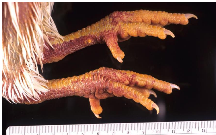
Slika 2. Potkožna krvarenja na stopalima i potkoljenicama kokoši uzrokovana influencom ptica.