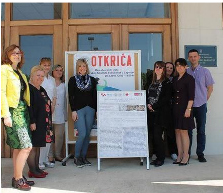
Slika 2. Projektni tim HRZZ projekta naziva “Inovativni funkcionalni proizvodi od janjećeg mesa“ (IP-2016-06-3685) s Veterinarskog fakulteta Sveučilišta u Zagrebu.