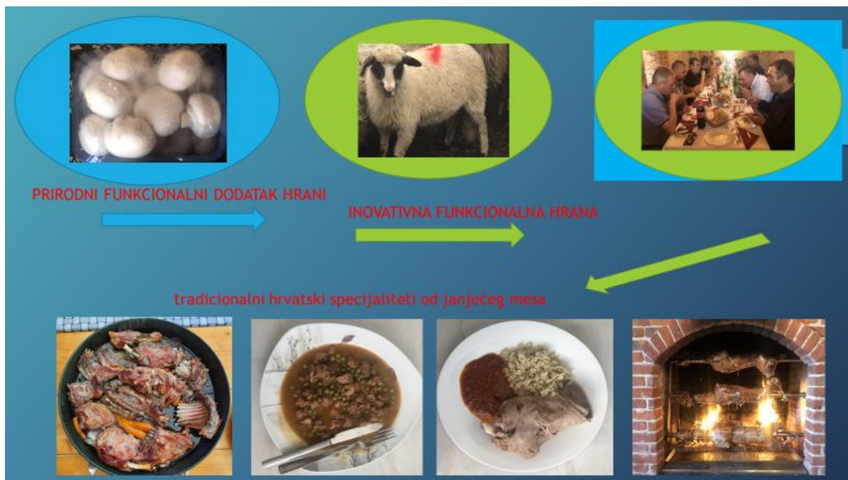
Slika 5. Inovativnost i kreativnost inovativnog proizvoda (janjetina s nižim udjelom kolesterola i masti) HRZZ projekta “Inovativni funkcionalni proizvodi od janječeg mesa“ (IP-2016-06-3685) u stupnju razvoja funkcionalnog laboratorijskog prototipa (izvor: https://www.inojanjetina.net ).