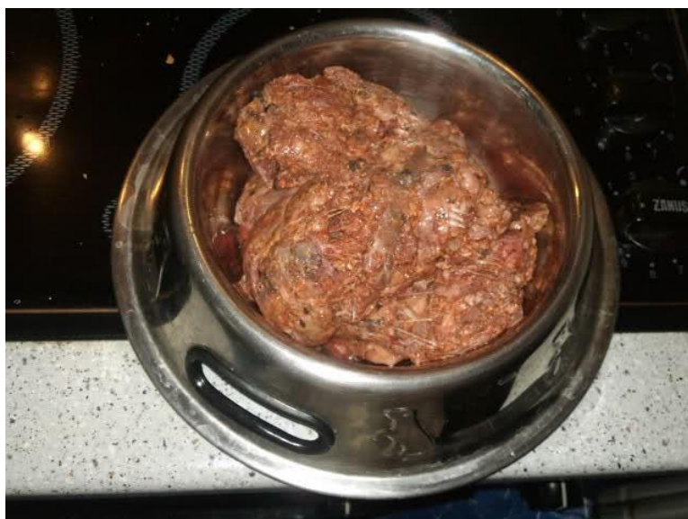
Slika 3. Sirova hrana za pse (BARF) prije hranjenja

Glavna razlika između pojmova BARF i Raw je u vrsti namirnica. Raw prehrana može sadržavati većinu sirovih namirnica npr. i recepte bez kostiju i mesa, a u BARF-u moraju biti kosti i meso. Pravilna prehrana za psa je ona koja psu osigurava uravnotežen unos proteina, bjelančevina, masti, vitamina, minerala i ugljikohidrata. Kod dehidrata to je dobiveno tvorničkim putem i zapakirano u dehidrat (suha hranu za pse). Smisao hranjenja psa BARF-om je omogućiti mu sve to kostima i raznolikim sirovim namirnicama. Nije dovoljno davati mu samo svježe namirnice, već one kao što je slučaj i s dehidratom moraju biti uravnotežene ovisno o veličini psa, pasmini, težini, dobi, trenutnom zdravstvenom stanju, ali i nasljednim bolestima. Sirova prehrana najbližnja je ljudskoj prehrani, odnosno temelji se na pravilnom kombiniranju raznovrsne sirove hrane.