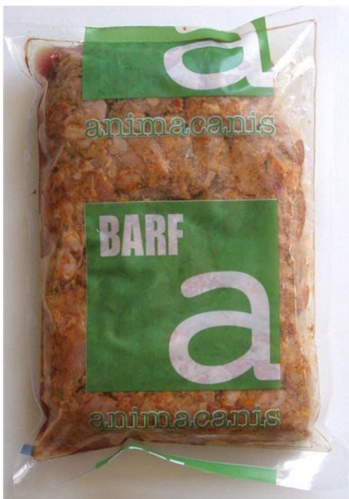
Slika 4. Sirova hrana za pse (BARF) zapakirana i smrznuta u plastičnoj ambalaži

U proizvodnji proizvoda od mesa ključna je svježa namirnica. Meso se nabavlja od lokalnih dobavljača i strogo se poštuje zakonom propisan neprekinuti hladni lanac pri transportu mesa. Svaka se pošiljka pri ulasku kontrolira, sprema u hladan lanac te prerađuje kako bismo bili sigurni u svježinu, kvalitetu i zdravstvenu ispravnost mesa. U sklopu proizvodnog procesa poštuje se apsolutna sljedivost namirnica u skladu s HACCP standardima. To doslovno znači da se za svaku porciju hrane (odnosno za svaku proizvodnu seriju – lot) točno može odrediti u kojoj je trgovini završila u prodaji, kao i na kojoj je farmi meso proizvedeno. HACCP sustavom postižemo sljedivost namirnica »od farme do stola«. Također, koristi se niz postupaka kojima se jamči kvaliteta i svježina. Kako bi se očuvala maksimalna svježina i higijenska ispravnost proizvoda, hrana se prije procesa smrzavanja vakuumira. Na taj se način proizvod štiti od oksidacije i bakterija te mu pomaže da dulje očuva svježinu. Odmah nakon pakiranja i označavanja proizvodi se pohranjuju u rashladnu komoru, gdje se brzim smrzavanjem dovode na željenu temperaturu. To je bitno jer se brzim smrzavanjem stvaraju sitni kristali leda koji, za razliku od smrzavanja klasičnom metodom, ne stvaraju velike kristale leda koji uništavaju staničnu membranu te time oštećuju strukturu stanice. Tim je proizvodnim postupkom održana visoka kvaliteta hranjivih sastojaka sadržanih u hrani.