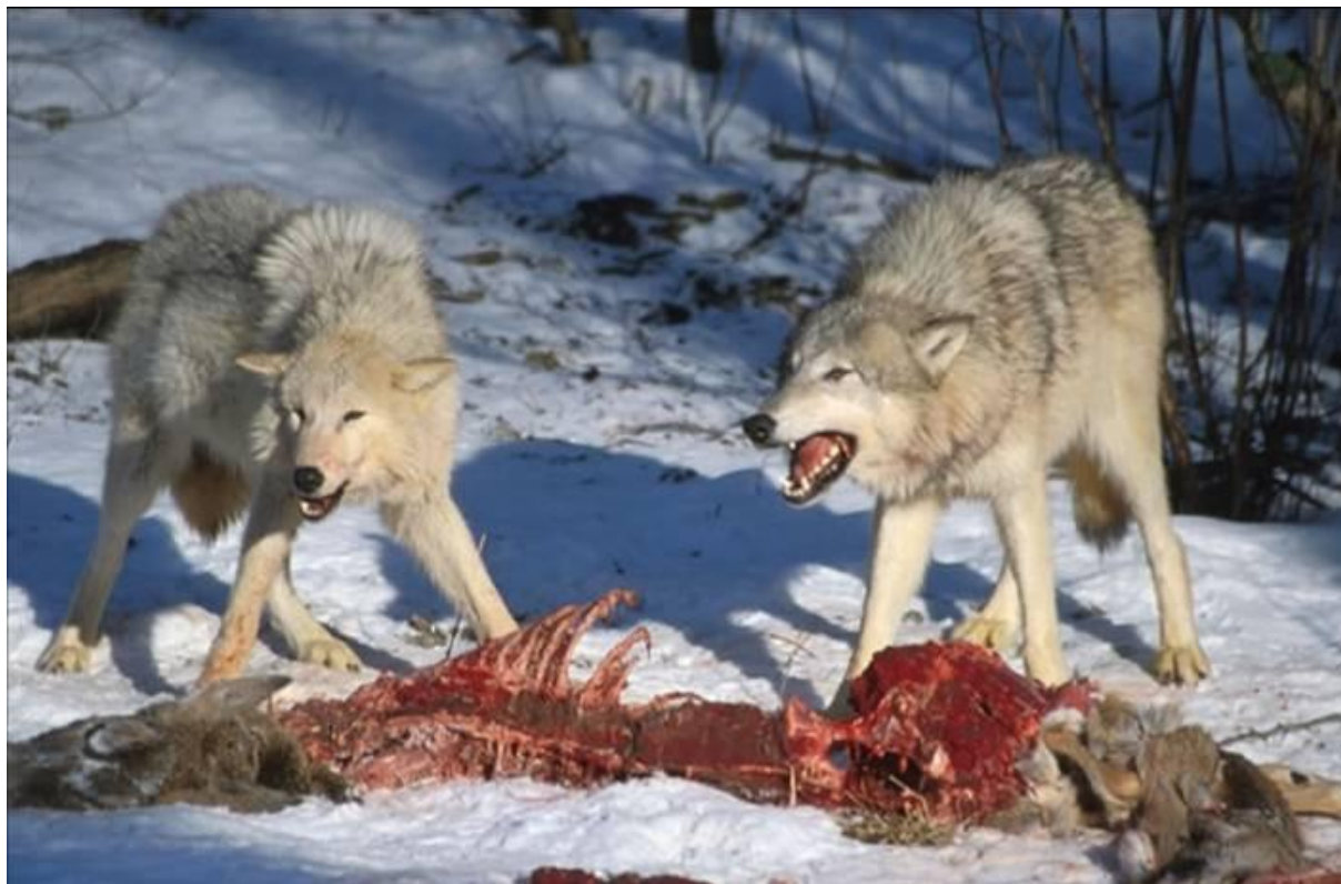
Slika 1. Vukovi konzumiraju sirovo meso jelena

U Hrvatskoj je najpoznatiji BARF (Biologically Appropriate Raw Food, odnosno biološki usklađena sirova hrana, a naglasak te filozofije prehrane je da hrana treba biti sirova i bez štetnih dodataka kojima obiluju drugi načini prehrane. U ovom diplomskom radu opisati ćemo pozitivne i negativne strane prehrane sirovom hranom (BARF-om) u pasa.