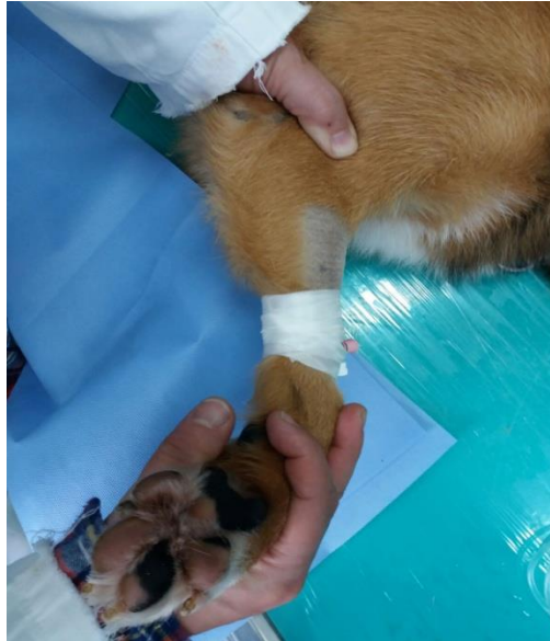
Slika 1. Pregled lakta na lakatnu displaziju, rotacijom lakta u polufleksiji

Kod svih zglobova koje pregledavamo važno je usporediti kutove maksimalne fleksije i ekstenzije s kontralateralnim ekstremitetom. Nakon lakta pregledava se rameni zglob i to probama fleksije i ekstenzije (CANNAP, 2007). Pri pregledu ramena u fleksiji i ekstenziji jednom rukom hvatamo podlakticu i povlačimo je kaudalno ili kranijalno uz tijelo životinje, dok drugom rukom istovremeno palpiramo rameni zglob uz vršenje pritiska prstima. Kod OCD-a ovim postupkom se izaziva bol. Kad rameni zglob postavimo u fleksiju, a prisutna je upala tetive bicepsa, izazvati ćemo bol. Otečenje ramenog zgloba dosta je teško prepoznati palpacijom jer je okružen snažnom muskulaturom koja služi za stabilizaciju. Za dijagnostiku tendinitisa tetive bicepsa brachii izvodi se fleksija ramenog zgloba uz istovremeni palpatorni pritisak u žlijebu iza tubera major s medijalne strane ramena.