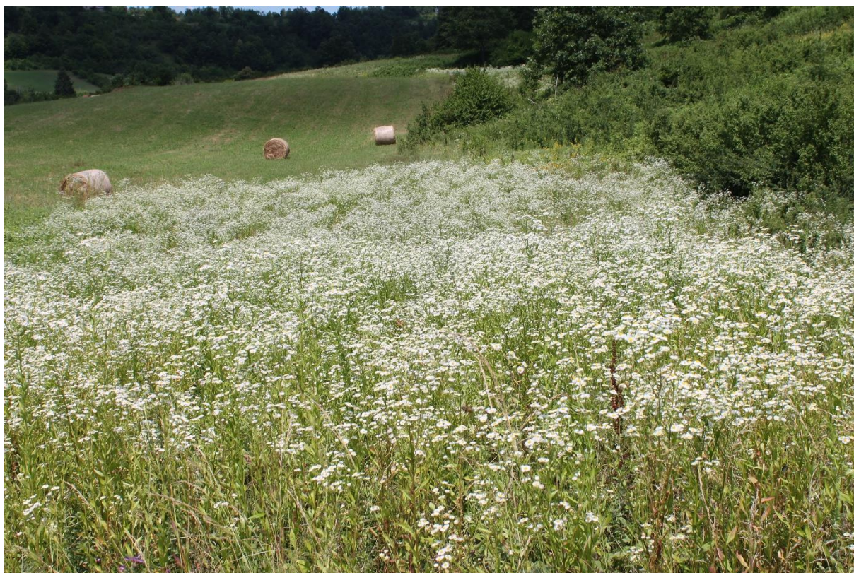
Slika 3. Pašnjak s područja Crkvine, u vlasništvu GEA-COM d.o.o. tijekom druge polovice svibnja 2018

maksimalnom pogreškom od < 4\% . Automatski postupak uzorkovanja napravljen je sa službenim reagensima (Daitro Lyse_DIFF, Diatro Cleanerand Diatro-Rinse) u četiri faze. Hematološki parametri su obuhvaćali ukupan broj bijelih krvnih stanica (WBC), broj limfocita (LYM), broj stanica srednje veličine (MID), broj granulocita (GRA), postotak limfocita (LY%), postotak stanica srednje veličine (MI%), postotak granulocita (GR%), broj crvenih krvnih stanica (RBC), hemoglobin (HGB), hematokrit (HTC), prosječni volumen eritrocita u litri krvi (MCV), prosječna količina hemoglobina u eritrocitu (MCH), prosječna koncentracija hemoglobina u eritrocitu (MCHC), širina raspodjele crvenih stanica (RDWc), broj trombocita (PLT), postotak trombocita (PCT), prosječni volumen trombocita (MPV) i širina raspodjele trombocita (PDWc). Krvni razmaz za diferencijalnu krvnu analizu su obojani panoptičkom metodom po Pappenheimu (koristeći May- Grünwald i Giemsa otopinu).