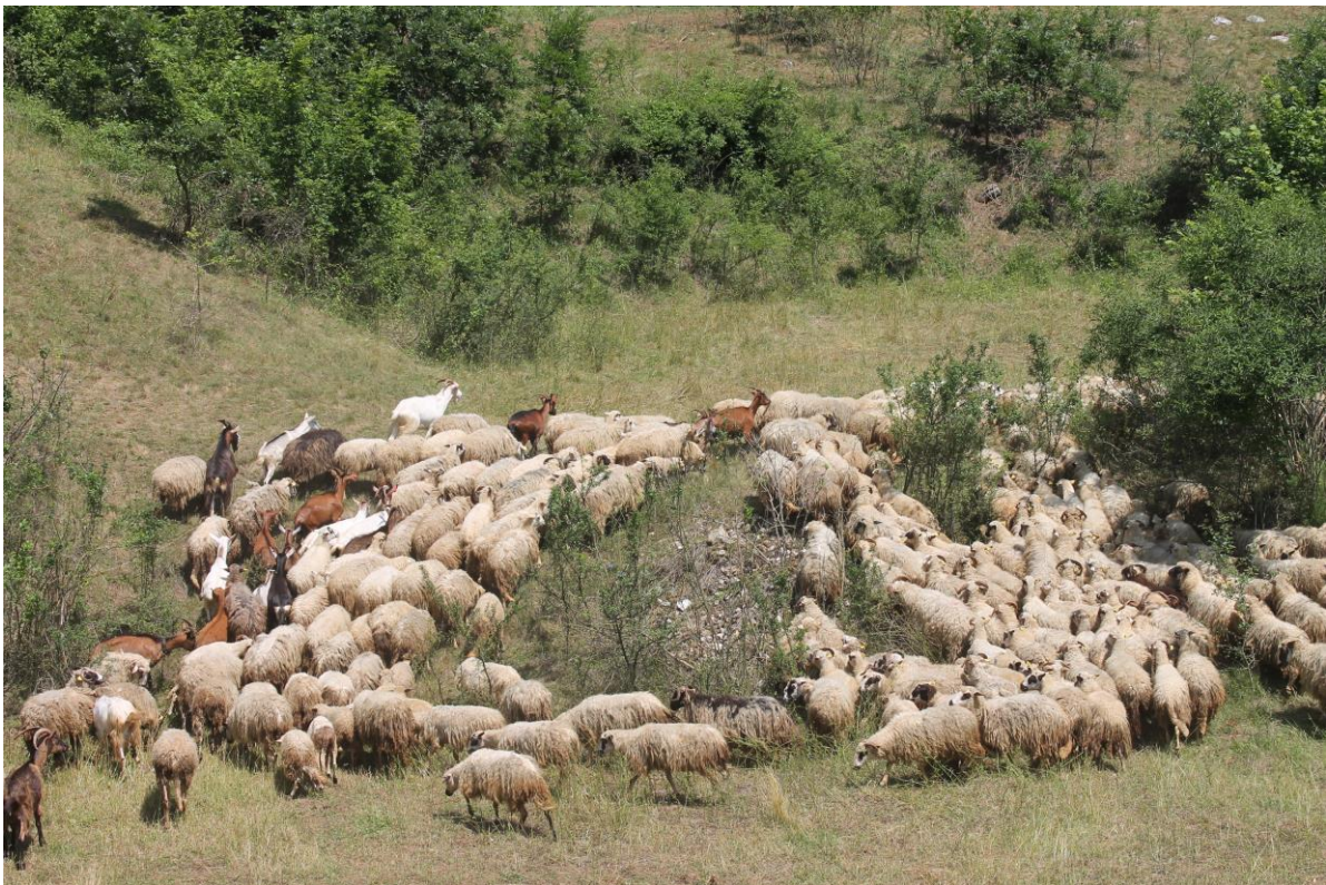
Slika 2. Stado ovaca pasmine Lička pramenka farme u vlasništvu GEA-COM d.o.o., Budačka rijeka

Istraživanje je provedeno na 36 nasumično odabranih ovaca pasmine lička pramenka, u dobi od 2 do 5 godina, prosječne tjelesne mase 35 kg. Farma se nalazi na području općine Krnjak, mjesto Crkvina. Na farmi je smješteno stado od ukupno 200 ovaca i 20 ovnova pasmine lička pramenka, različite dobi. Ovce se drže ekstenzivno, u toplijim mjesecima godine na ispaši (Slika 2.), a zimi u staji. Životinje se u vrijeme pašne sezone drže na ispaši tijekom cijeloga dana, dok se zimi hrane sijenom s okolnih pašnjaka.