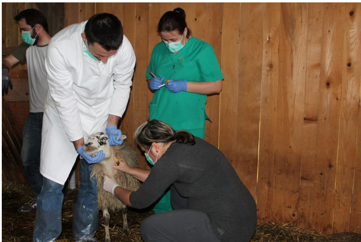
Slika 4. Vađenje krvi ovcama za hematološke i biokemijske analize

(vrijednosti kolesterola (KOL), triglicerida (TRIG), lipoproteina male gustoće (LDL), lipoproteina velike gustoće (HDL), proteina (PROT), albumina (ALB), globulina (GLOB), agluoze (GLU), uree (UREA), kreatinina (KREA), kalija (K), natrija (Na), klora (Cl), kalcija (Ca) i fosfora (P)) određivani su na biokemijskom analizatoru Beckman Coulter AU 680 u Kliničkom zavodu za medicinsku biokemiju i laboratorijsku medicinu Kliničke bolnice Merkur u Zagrebu.