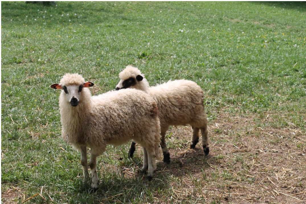
Slika 1. Janjad ličke pramenke

su dlakom, a ostali dio tijela vunom. Ovnovi imaju snažne rogove, a ovce su najčešće bez rogova. Boja je vune pretežno bijela, ali učestalo se javlja i siva, smeđa ili crna boja vune. U većine bijelih grla na glavi i nogama javljaju se točkasta i veća područja tamne dlake (Slika 1.). Jedno od najvažnijih osobina pramenke jest njezina velika otpornost i izdržljivost za kretanje na velike udaljenosti te dobro iskorištavanje travnjaka loše kvalitete. Tjelesna masa je jedno od obilježja koje pokazuje najveći opseg varijacija. Tako je, ovisno o uvjetima hranidbe, tjelesna masa ovaca od 25 do 70 kg, a ovnova od 30 do 90 kg. Runo je otvorenog tipa, sa šiljastim pramenovima, a finoća vlakna je prosječno 30 do 50 mikrona. Godišnji nastrig vune je nizak, od 1,0 do 3,0 kg. Duljina pramenova je od 12 do preko 20 cm, a randman vune je relativno visok (50 do 70 %). Pramenke su izrazito kasnozrele ovce koje se prvi put pripuštaju u dobi od godine i pol. Plodnost ovaca je prosječno 90 %. Porodna masa janjadi je od 2 do 4,5 kg. Proizvodnja mesa po ovci je niska. Janjad se kolje s malom tjelesnom masom, prosječno oko 20 kg žive vage. Klaonička iskoristivost zaklane janjadi također je relativno niska i kreće se oko 45 %. Međutim, kvaliteta mesa je izvrsna stoga se smatra kulinarskim specijalitetom. Prosječna proizvodnja mlijeka u pramenke je varijabilna i kreće se od 30 do 60 L (bez mlijeka koje posiše janje) u laktaciji koja traje oko šest mjeseci.