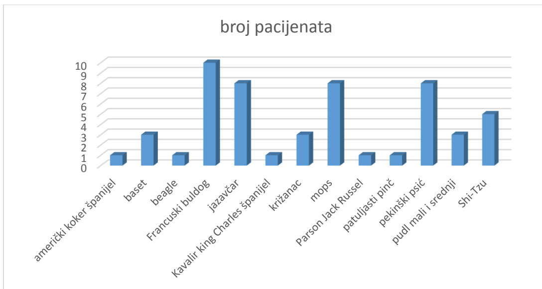
Slika 1. Grafički prikaz pasmina unutar skupine H.

Unutar skupine NH, 66,04% (35/53) pacijenata bilo je križane pasmine dok su u preostalom postotku 9,43% (5/53) zabilježeni malteški psić i ovčari (njemački ovčar, hrvatski ovčar, škotski ovčar, švicarski bijeli ovčar), 7,55% (4/53) terijeri ( američki stafordski terijer, stafordski bulterijer, jorkširski terijer i njemački lovni terijer). Dva psa (3,77%) bila su pasmine zlatni retriever dok je po u jednom primjerku (1,89%) zabilježen seter i argetinski pas.