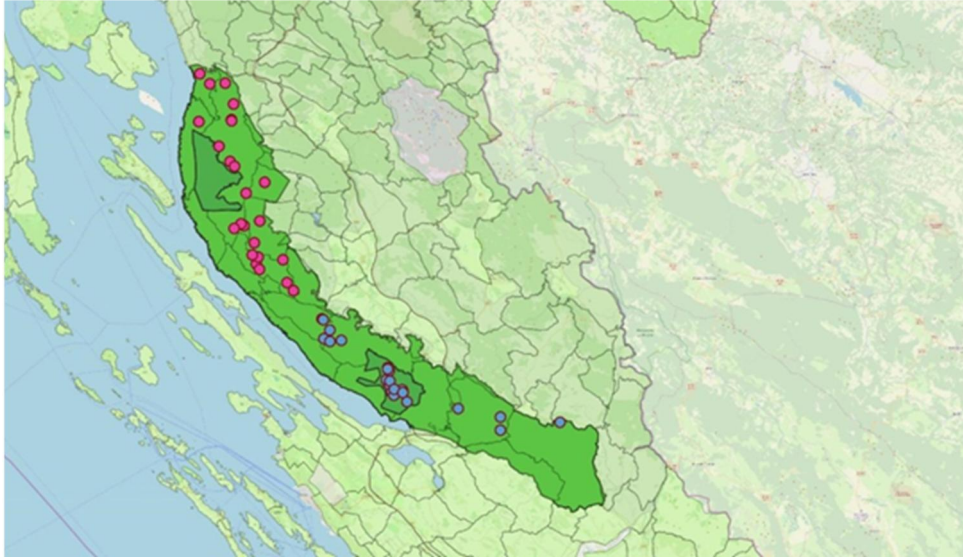
Slika 2. Lokacije fotozamki postavljenih na sjevernom (crvena boja ) i južnom (plava boja) dijelu Velebita

Javnom ustanovom Park prirode Velebit te Nacionalnim parkom Paklenica postavljeno je 54 fotozamki na površini od ukupno 2 131 km 2 , te su bile aktivne od 20.03.2018. do 21.03.2019. godine, ukupno 6 141 dan (Slika.