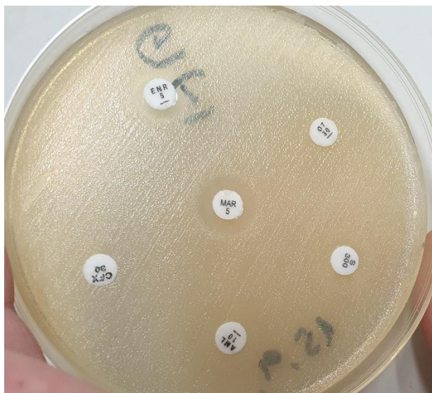
Slika 4. Disk difuzijski postupak, E. faecalis (izolat br. 2.)