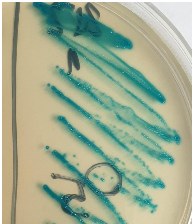
Slika 3. Bakterije vrste E. faecalis na Brilliance UTi Clarity agar