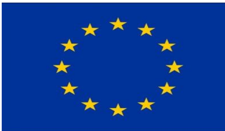
Slika 2. Zastava Europske unije