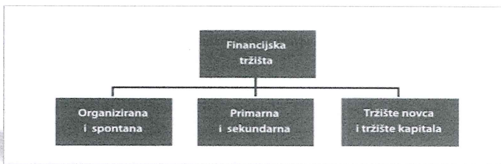
Slika 1 - Podjela financijskih tržišta