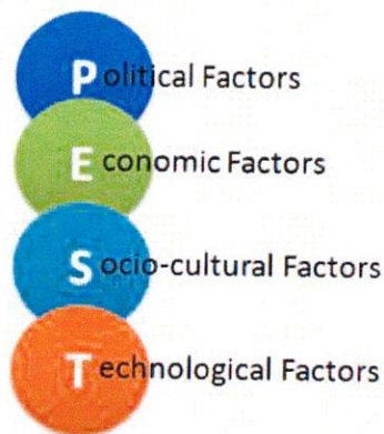
Slika 1: Čimbenici makrookruženja