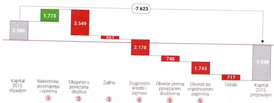
Slika 4 : Promjene kapitala kompanije Konzum d.d. na temelju rezultata revizije