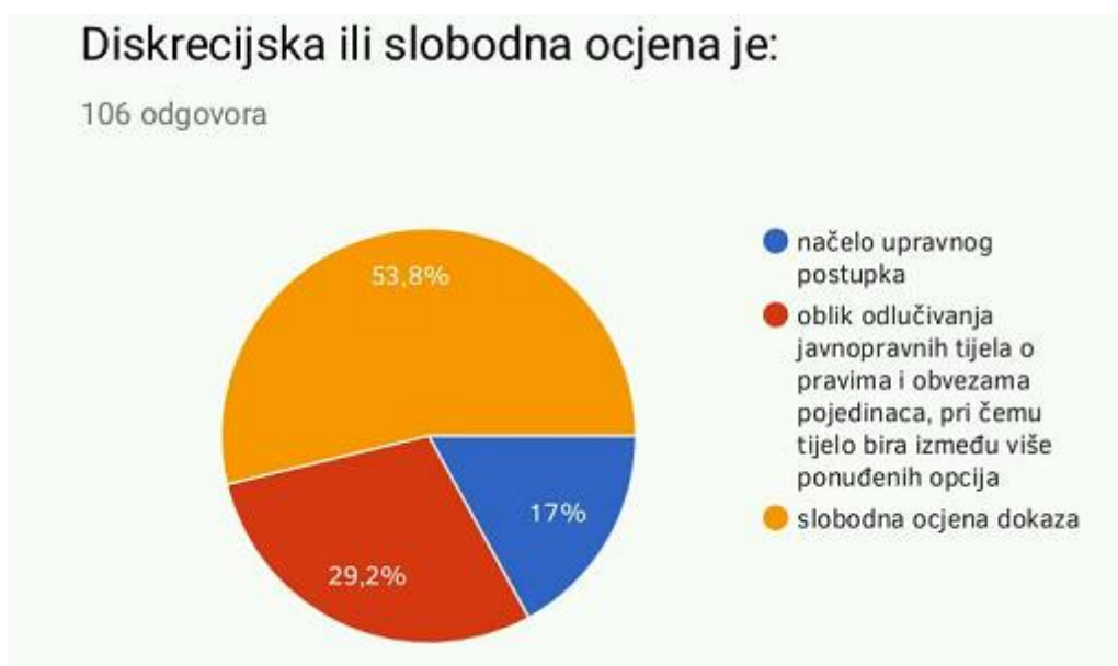
Slika 2. Definicija slobodne ocjene