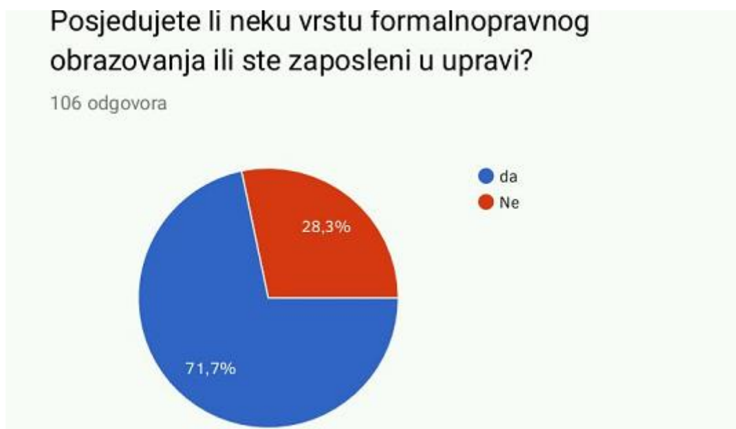
Slika 1. Upućenost ispitanika u pravila upravnog postupka