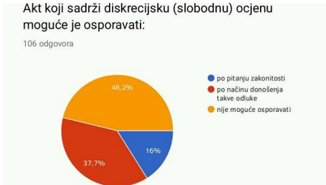
Slika 3. Osnove za osporavanje akta